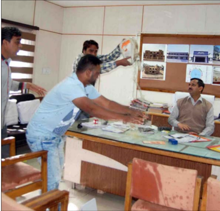
दाणीलीमडा इलाके में पीने के पानी को लेकर समस्या खड़ी हो गई है। प्रदुषित पानी के विरोध में स्थानिय लोगों ने मणीनगर झीलन ऑफिस पर प्रदर्शन किया।