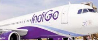
नई दिल्ली (एजेंसी)।

यात्री संख्या के मामले में देश की सबसे बड़ी विमान सेवा कंपनी इंडिगो ने कंपनी के प्रवक्तों के बीच मतभेद के बारे में मॉडिआ में आई खबरों के बीच कहा है कि प्रबंधन में बदलाव की कयासबाजी आधारहीन है और