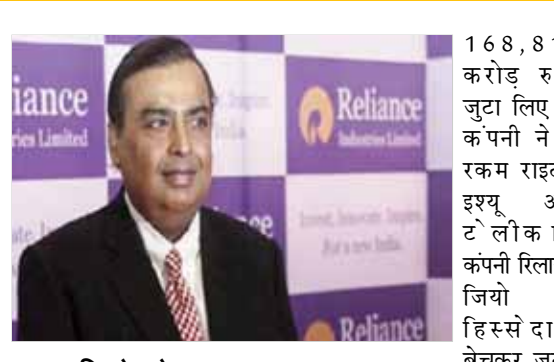
बिजनस डेस्क। मार्केट कैप के लिहाज से देश की सबसे बड़ी कंपनी रिलायंस इंडस्ट्रीज ने 58 दिन में कुल

168,818 करोड़ रुपए जुटा लिए हैं। कंपनी ने ये रकम राइट्स इश्यू और टें लो क र्म कंपनी रिलायंस हिस्से दारी बेचकर जुटाए हैं। रिलायंस इंडस्ट्रीज के चेयरमैन मुकेश अंबानी ने शुक्रवार को घोषणा की कि रिलायंस ने दुनिया के टॉप वित्तीय निवेशकों से अपनी