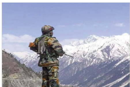
नई दिल्ली (एजेंसी)।

नेशनल डेस्क। गुजरात के कई जिलों में रविवार को भारी बारिश हुई। देवघूमि झारका जिले के खाम्बालिया तहसील में दिन में 434 मिलीमीटर बारिश हुई। इस तहसील में शाम 6 से रात 8 बजे के बीच दो घंटे के दौरान 292 मिलीमीटर बारिश हुई, जिससे इलाकों में काफी पानी भर गया। कुछ कॉलोनिनों में पानी भरने के कारण गाड़ियां तैरने लगी हैं, जबकि सड़कों का तो बुरा हाल रहा। अधिकारियों ने बताया कि सौराष्ट्र के पोरबंदर, गिर सोमनाथ, जूनागढ़ और अमरेली जिलों के साथ-साथ दक्षिण गुजरात के वलसाड और नवसारी जिलों में भी दिनभर भारी बरसात हुई। भारतीय मौसम विभाग के अहमदाबाद केंद्र ने अगले तीन दिनों के दौरान सौराष्ट्र, उत्तर और दक्षिण गुजरात में भारी बारिश का पूर्वानुमान बताया है। पुलिस ने बताया कि सुरेंद्रनगर जिले में बिजली गिरने से एक किसान की जान चली गई जबकि एक व्यक्ति के डूबने का अंदेश है। वह एक पिकअप वैन में सफर कर रहा था जो पानी की तेज लहरों में बह गई। राज्य आपात अभियान केंद्र के अनुसार, सुबह से रात 8 बजे तक पोरबंदर के राणावाड में 152 मिलीमीटर, पोरबंदर में 120 मिलीमीटर, गिर सोमनाथ के सुत्रपाड में 103 मिलीमीटर, नवसारी के चिखली में 99 मिलीमीटर, वलसाड के परदी में 98 मिलीमीटर बारिश हुई है।