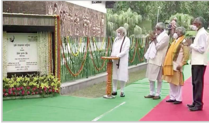
पुष्पांजलि अर्पित की और केंद्र का अवलोकन किया। आरएसके में स्थित सभागार में प्रधानमंत्री ने 'दशक 360 डिग्री' का अनूठा ऑडियो-विजुअल कार्यक्रम देखा, जिसमें भारत की स्वच्छता की कहानी यानी दुनिया के इतिहास में लोगों की आदतों में बदलाव लाने वाले सबसे बड़े अभियान की यात्रा दिखाई गई।

गंदगी अगर सबसे ज्यादा नुकसान किसी का करती है, तो वो गरीब है। जबतक जनता में आत्मविश्वास पैदा नहीं होता, तबतक वो आजादी के लिए खड़ी कैसे हो सकती था? इसलिए, साउथ अफ्रीका से लेकर चंपारण और साबरमती आश्रम तक, उन्होंने स्वच्छता को ही अपने आंदोलन का बड़ा माध्यम बनाया। महात्मा गांधी को समर्पित राष्ट्रीय स्वच्छता केंद्र (आरएसके) की प्रधानमंत्री ने सबसे पहले घोषणा 10 अप्रैल 2017 को गांधीजी के चम्पारण 'सत्याग्रह' के 100 वर्ष पूरे होने के मौके पर की थी। यह स्वच्छ भारत मिशन पर एक परस्पर सवादात मक (इंटरैक्टिव) अनुभव केंद्र होगा। आरएसके पहुंचने के बाद प्रधानमंत्री ने वहां स्थित महात्मा गांधी की प्रतिमा पर