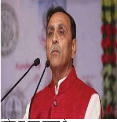
आदेश पर राज्य सरकार ने मंगलवार से मास्क नहीं पहनने

गुजरात में लगातार बढ़ रहे कोरोना मामलों को देखते हुए राज्य सरकार ने महत्वपूर्ण फैसला किया है। मंगलवार से मास्क नहीं पहनने पर रु. 1000 का जुर्माना लगाया जाएगा। गुजरात हाईकोर्ट के आदेश का मुख्यमंत्री विजय रूपाणी ने स्वीकार करते हुए अब रु. 500 के बजाए 1000 रुपए जुर्माना लगाने का फैसला किया है। सोमवार को पत्रकार परिषद में इसका ऐलान करते हुए मुख्यमंत्री ने कहा कि गुजरात हाईकोर्ट के