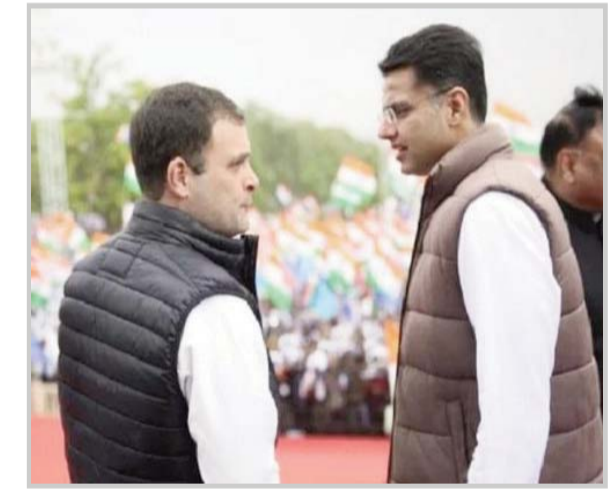
दिया था। बागी रख अपनाने के साथ ही पायलट कई बार स्पष्ट कर चुके हैं कि वह भाजपा में शामिल नहीं होंगे। उनके समर्थक विधायकों का कहना है कि वे गहलोट के नेतृत्व में काम करने के इच्छुक नहीं हैं।

करने का प्रयास करेंगे। उधर, पायलट और बागी विधायकों के साथ बातचीत और सुलह के बारे में पूछे जाने पर कांग्रेस के एक वरिष्ठ नेता ने कहा, हमने पहले भी कहा है और आज भी कह रहे हैं कि अगर पायलट और दूसरे बागी विधायक सरकार को अस्थिर करने के प्रयास के लिए माफ़ी मांग लें तो पार्टी उन्हें फिर से अपनाते पर विचार कर सकती है। मुख्यमंत्री गहलोट के खिलाफ खुलकर बग़ावत करने और विधायक दल की बैठकों में शामिल नहीं होने के बाद कांग्रेस आलाकमान ने पायलट को प्रदेश कांग्रेस कमेटी के अध्यक्ष और उप मुख्यमंत्री के पदों से हटा