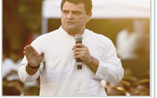
ने आठ अगस्त 1942 को उन्होंने भारत छोड़ो आंदोलन की शुरुआत की थी।

78वीं वर्षगांठ पर गांधीजी के 'करो या मरो' के नारे को नए मायने देने होंगे। अन्याय के खिलाफ लड़ो, डरो मत। राहुल ने 'भारत छोड़ो आंदोलन की तर्रार भी शेर की जिसमें राष्ट्रपिता महात्मा गांधी एक विशाल जनसभा को संबोधित कर रहे हैं। महात्मा गांधी ने आठ अगस्त 1942 को उन्होंने भारत छोड़ो आंदोलन की शुरुआत की थी। महात्मा गांधी एक विशाल जनसभा को संबोधित कर रहे हैं। महात्मा गांधी