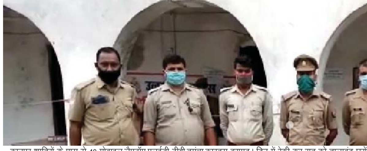
कानपुर शातिरों के पास से 40 मोबाइल,लैपटॉप,एलईडी टीवी,तमंचा,कारतूस बरामद। दिन में रेकी कर रात को तालाबंद घरों व दुकानों को बनाते थे निशाना। चक्रेरी,नौबस्ता और बिधनू में दर्जनों चोरी की वारदातों को अंजाम दे चुके थे शातिर चोर।।