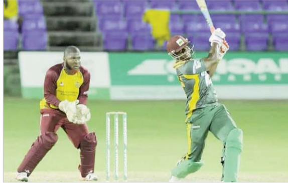
पोर्ट ऑफ स्पेन।

(सीपीएल) में बारबाडोस ट्रिडेंट्स ने जमैका तख्तावाह को 36 रन से करारी शिकस्त दी। बारबाडोस ने