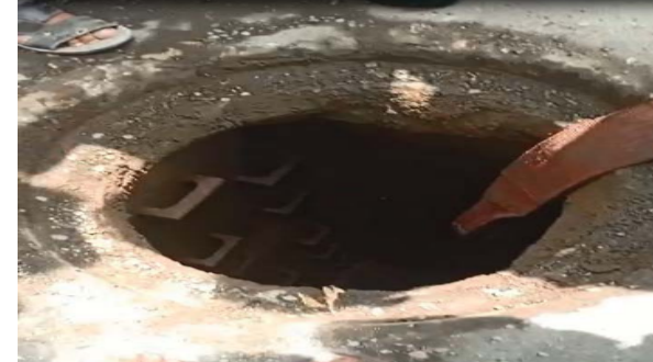
नानपुरा में ड्रेनेज की गटर में काम करते समय मजदूरों को जरूरी सेफ्टी दिए बिना ही काम करवाया जा रहा था।

अस्पताल में तथा जतिन को स्मीमेर अस्पताल में ले जाया गया, लेकिन दोनों को डॉक्टरों