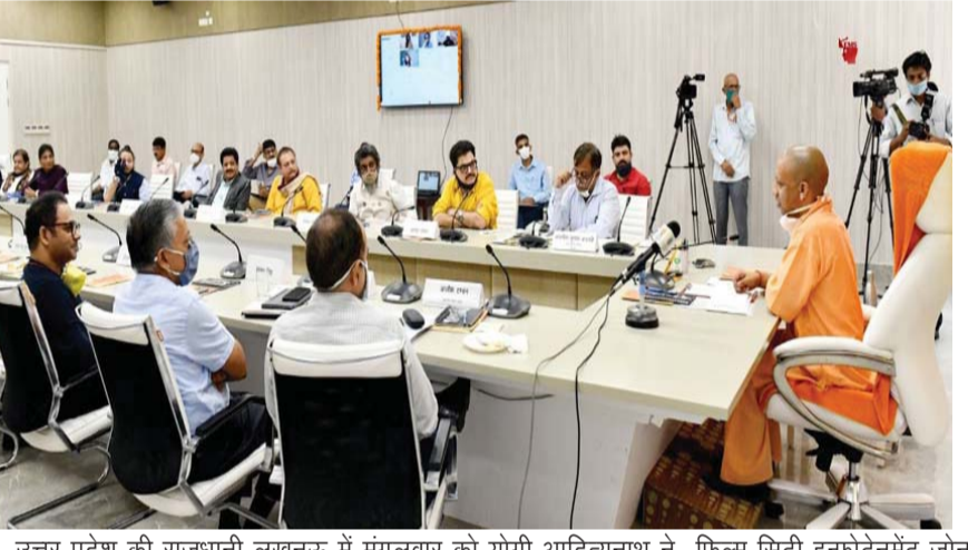
उत्तर प्रदेश की राजधानी लखनऊ में मंगलवार को योगी आदित्यनाथ ने फिल्म सिटी इन्फोटेनमेंट जोन का शुभारंभ किया और फिल्म जगत की हस्तियों को उत्तरप्रदेश का आमंत्रण दिया।