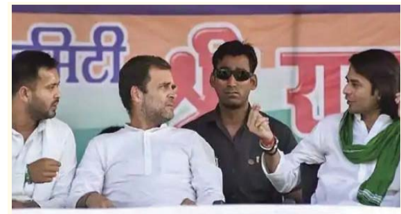
कांग्रेस इस बार वर्ष 2015 के मुकाबले काफी ज्यादा सीट पर चुनाव लड़ रही है। पिछले चुनाव में कांग्रेस ने 41 सीट पर चुनाव लड़कर 27 सीट दर्ज की थी। जबकि इस बार पार्टी 70 सीट पर किस्मत आजमा रही है। पार्टी को उम्मीद है कि वह अपना पुराना प्रदर्शन बरकरार रखने में सफल रहेगी, पर कई नेता मानते हैं कि

नई दिल्ली। बिहार विधानसभा में कांग्रेस के सामने अपना ही प्रदर्शन दोहराने की चुनौती है। पार्टी इस बार पिछले विधानसभा चुनाव के मुकाबले ज्यादा सीट पर चुनाव लड़ रही है, पर गठबंधन का स्वरुप बदल गया है। पार्टी को इस बार उसी जेडीयू के खिलाफ वोट मांगने होंगे, जिसके साथ गठबंधन में उसने 2015 के चुनाव में पिछले दो दशक में सबसे अच्छे प्रदर्शन किया।