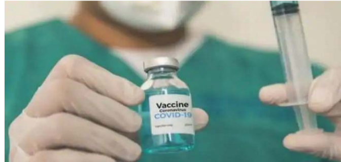
पेपर स्ट्रिप जांच अगले कुछ हफ्ते में शुरू की जा सकती है। हर्षवर्धन ने कहा कि वर्तमान में कोविड-19 टीका मानव क्लीनिकल परीक्षण के पहले, दूसरे और तीसरे... विभिन्न चरणों में है जिसके परिणाम की

नई दिल्ली। केंद्रीय स्वास्थ्य मंत्री डॉ. हर्षवर्धन ने रविवार को कहा कि कोरोना वायरस के संक्रमण से लोगों को बचाने यानी हर किसी का टीकाकरण के लिए एक से अधिक वैक्सीन निर्माता के साथ गठजोड़ करना होगा। साथ ही उन्होंने कहा कि यह भी सुनिश्चित करने की आवश्यकता है कि सबसे कमजोर समूह इसे पहले प्राप्त करें। मंत्री ने कहा, भारत के बड़े जनसंख्या आकार को ध्यान में रखते हुए, एक टीका या वैक्सीन निर्माता पूरे देश में टीकाकरण की आवश्यकताओं को पूरा करने में सक्षम नहीं होगा। इसलिए, हम भारतीय आबादी के लिए उनकी उपलब्धता के अनुसार देश में कई कोरोना टीकों को पेश करने की व्यवहार्यता का आकलन करने के लिए तैयार हैं।