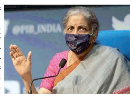
करोड़ रुपये के अतिरिक्त पूंजीगत व्यय की भी घोषणा की। उन्होंने कहा कि यह अतिरिक्त राशि सड़क, रक्षा ढांचे, जलापूर्ति और शहरी विकास पर खर्च की जाएगी। यह 4.13 लाख करोड़ रुपये के निर्धारित बजट के अतिरिक्त होगी।

रुपये की राशि शेष राज्यों को दी जाएगी। वहीं 2,000 करोड़ रुपये उन राज्यों को दिए जाएंगे जिन्होंने पहले बताये गये सुधारों को पूरा कर लिया होगा। सीतारमण ने योजना के बारे में जानकारी देते हुये कहा कि पूरी राशि नई या मौजूदा पूंजीगत परियोजनाओं पर खर्च की जा सकेगी। सीतारमण ने कहा कि राज्य ठेकेदारों और आपूर्तिकर्ताओं के लिए बिलों का निपटान भी इससे कर सकते हैं, लेकिन पूरी राशि का भुगतान 31 मार्च, 2021 से पहले करना होगा। उन्होंने कहा कि यह कर्ज राज्यों की उधारी सीमा से अलग होगा। 50 साल बाद रुपये उत्तराखंड और हिमाचल प्रदेश को दिए जाएंगे। वित्त मंत्री ने केंद्र सरकार द्वारा 25,000