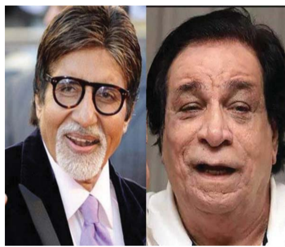
कादर खान के बारे में