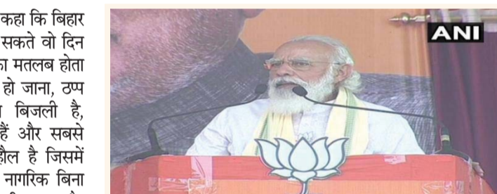
पीएम मोदी की रैली को लेकर खास तैयारी

पटना। बिहार के चुनावी रण में प्रधानमंत्री नरेंद्र मोदी उतर चुके हैं। सासाराम में पहली चुनावी रैली को संबोधित करते हुए पीएम मोदी ने कहा कि कोरोना का मुकाबला करते हुए सारी सावधानी के साथ लोग लोकतंत्र के महापर्व का जश्न मना रहा है। प्रधानमंत्री ने कहा कि भारत की विकास यात्रा में अहम योगदान देने वाले बिहार में आकर बेहद खुश हूँ। बिहार के लोगों अपना संदेश सुना दिया है। बिहार के लोग कम्प्यूजन में नहीं रहते हैं। पीएम मोदी ने कहा कि बिहार के मतदाता इतने समझदार हैं कि वो भ्रम फैलाने वालों की बातों में नहीं आते हैं। प्रधानमंत्री नरेंद्र मोदी ने विपक्षी पार्टी खास तौर से आरजेडी पर बिना नाम लिए