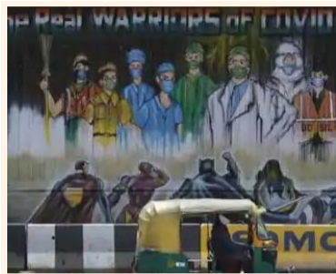
सितंबर के मुकाबले अक्टूबर में जहां टेस्ट की संख्या बढ़ी, वहीं मामलों के पॉजिटिव आने की दर 2.5 फीसदी घट गई। सक्रिय मामले भी 10 फीसदी से नीचे बने हुए हैं। स्वस्थ होने की दर भी 89.20 फीसदी है।

पिछले 24 घंटे में 55,839 नए कोरोना मामले दर्ज किए गए और 702 संक्रमितों की मौत हुई। इस अवधि में 79,415 मरीज ठीक भी हुए हैं। देश के 22 राज्यों और केंद्र शासित प्रदेशों में 20,000 से कम सक्रिय मामले हैं। केवल केरल, कर्नाटक और महाराष्ट्र में 50,000 से ज्यादा सक्रिय मामले दर्ज हो रहे हैं। सबसे ज्यादा सक्रिय केस महाराष्ट्र में हैं। देश में मृत्यु दर और सक्रिय मामलों की दर में भी लगातार गिरावट दर्ज की जा रही है। मृत्यु दर गिरकर 1.51 बने है। इसके अलावा सक्रिय मामले जिनका इलाज चल है उनकी दर भी 10 फीसदी से कम है। वल्टेमीटर के मुताबिक, सक्रिय मामले और कोरोना संक्रमितों की संख्या के हिसाब से भारत दुनिया का दूसरा सबसे प्रभावित देश है। मौत के मामले में अमेरिका और ब्राजिल के बाद भारत