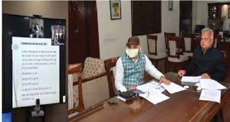
उन्होंने राज्य में कृषि के क्षेत्र में हो रहे नवाचार की सराहना