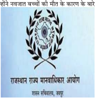
राजस्थान राज्य मानवाधिकार आयोग