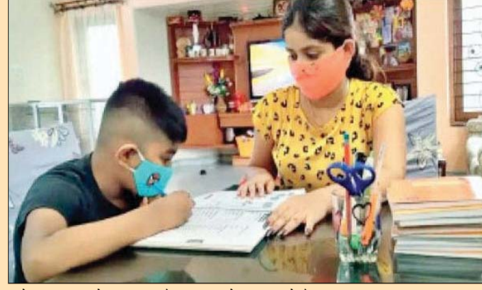
नाते आपकी जिम्मेदारी बनती है कि पता करे कि ट्यूशन टीचर आपके बच्चे को ठीक से पढ़ा रहे हैं या नहीं। कभी-कभी ट्यूशन टीचर लापरवाही

आ ज के समय में सभी को आगे बढ़ने की होड़ में कुछ अलग करना चाहते हैं। आप अपने बच्चे को परफेक्ट बनाने के लिए उसकी हर मुश्किल आसान करते हैं। जब आप किसी विषय को समझाने में मुश्किल का सामना करते हैं तो ट्यूशन का सहारा लेते हैं। ट्यूशन पढ़ते समय बच्चा अकेले ही होता है इसलिए आपको इन बातों का ध्यान रखना होगा। अपने बच्चे को ट्यूशन भेजने से पहले उसे मानसिक रूप से तैयार कर दें कि उसे क्या पढ़ाई करना है। उसके साथ ले जाने वाली किताब कॉपी की व्यवस्था करें। एक माता-पिता होने के