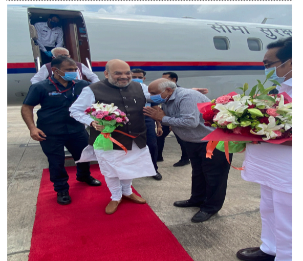
गुजरात के शपथ ग्रहण समारोह में शामिल होने अहमदाबाद पहुंचे केन्द्रीय गृह मंत्री अमित शाह का एयरपोर्ट पर स्वागत करते पदनामित मुख्यमंत्री भूपेन्द्र पटेल।

मुख्यमंत्री की शपथ बधाई देता विश्वास है नरेन्द्र मोदी और आपके गुजरात की यात्रा की होंगी।' मुख्यमंत्री शिवराज सिंह ट्वीट कर गुजरात के मुख्यमंत्री भूपेन्द्र पटेल को शपथ लेने पर आत्मीय बधाई। मुझे पूर्ण विश्वास है कि आपके नेतृत्व में राज्य में विकास के नए आयाम गढ़े जाएंगे और समाज के हर वर्ग के जीवन में सकारात्मक बदलाव आएगा। उत्तर प्रदेश के मुख्यमंत्री योगी आदित्यनाथ ने भूपेन्द्र पटेल को गुजरात के मुख्यमंत्री पद की शपथ लेने पर हार्दिक बधाई देते हुए कहा कि आशा व पूर्ण विश्वास है कि आपके ऊर्जावान और संवेदनशील नेतृत्व में गुजरात विकास की नूतन उन्नाइयों को स्पर्श करेगा। प्रभु श्रीराम से आपके उज्ज्वल एवं उत्कृष्ट कार्यकाल की कामना है।