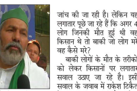
नयी दिल्ली (एजेंसी)।

लखीमपुर खीरी में हुई हिंसा में 8 लोगों को मौत हुई थी। इन 8 लोगों में चार किसान थे जबकि बाकी भाजपा कार्यकर्ता बताए जा रहे हैं। एक पत्रकार की भी मौत हुई थी। जानकारी के मुताबिक यह दावा किया जा रहा है कि भाजपा नेता की गाड़ी से पहले किसानों को कुचला गया जिसके बाद उनकी मौत हो गई। इसके बाद वीडियो वायरल हो रहा है। उसे साफ तौर पर दिखाई दे रहा है कि कुछ लोग 1-2 लोगों को धेरकर लाठी से मार रहे हैं। माना जा रहा है कि ऐसे ही किसानों ने भाजपा कार्यकर्ता को मारा है। हालांकि उसकी पुष्टि नहीं हुई है। फिलहाल