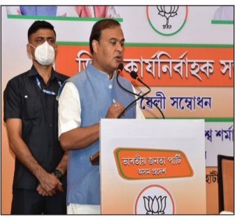
नई दिल्ली (एजेंसी)।

उत्तर प्रदेश में हाल ही में हिरासत के दौरान फर्श पर झाड़ू लगाने के लिये उन पर कटाख करते हुये असम के मुख्यमंत्री हिमंत बिस्व सरमा ने शनिवार को कहा कि यह कोई खबर कैसे है, क्योंकि कमरे की सफाई करना तो किसी के भी दैनिक काम काज का हिस्सा है। इंडिया टुडे कॉन्क्लेव 2021 में हिस्सा लेते हुए सरमा ने कहा कि