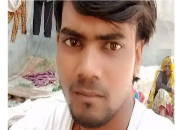
गोलू के पिता का कहना है कि उनके गृहनगर में अंतिम संस्कार किया जाएगा (फाइल फोटो)

पीने के लिए घर निकला था, लेकिन सुबह वापस नहीं लौटा था। आज सुबह गोलू के दोस्त घर से नौकरी पर जाने के लिए अमरोली-सायण रेलवे ट्रेक से गुजर रहे थे। तब गोलू को लहलुहान हालत में देख चौंक उठे और तुरंत एम्ब्युलेंस 108 की मदद से उसे अस्पताल पहुंचाया। गोलू ने अपने दोस्तों को बताया कि वह शराब पीकर घर लौट रहा था, लेकिन नशे में रेलवे ट्रेक पर सो गया। उस वक्त वहां गुजरी ट्रेन से उसके पैर कट गए। पैर कटने के बाद जान बचाने के लिए किसी प्रकार अपने शरीर को घसीट कर एक गड्ढे के पास ले गया और करीब 9 घंटों तक पड़ा रहा। गोलू के दोस्तों ने बताया कि उसके पैर बुरी तरह से कुचल गए हैं, जिसे काट कर उसकी जान बचाने का प्रयास जहां इलाज के दौरान उसकी मौत हो गई।