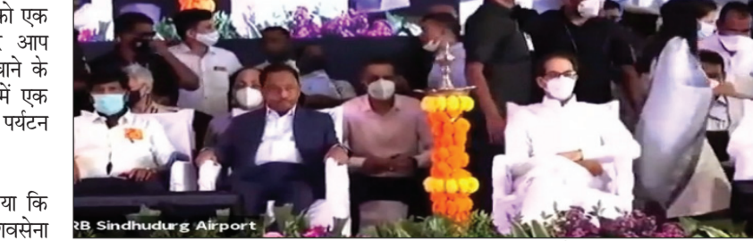
18 Sindhudurg Airport

उद्घाटन से पहले राणे ने दावा किया कि राज्य के सिंधुदुर्ग जिले के विकास में शिवसेना का कोई योगदान नहीं है और वह तटीय जिले में चिपी ग्रीनफील्ड हवाई अड्डे के निर्माण के पीछे प्रेरक शक्ति थे। हुए राणे ने कहा कि हवाई अड्डा का श्रेय उन्हें और भाजपा को जाता है। राणे ने कहा कि हवाई अड्डे की अवधारणा 1998-1999 में उनके मुख्यमंत्री रहने के दौरान की गई। उन्होंने कहा कि सिंधुदुर्ग के