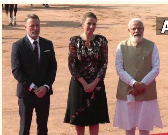
डेनमार्क की पीएम मेटे फ्रेडरिकसेन का राष्ट्रपति भवन में औपचारिक स्वागत किया गया। इस दौरान पीएम नरेंद्र मोदी ने उनकी अगवानी की।

प्रधानमंत्री मेटे फ्रेडरिकसेन पीएम मोदी के साथ हरित सार्वभौमिक गठजोड़ के क्षेत्र में प्रगति की समीक्षा करने के साथ द्विपक्षीय संबंधों के विविध आयामों पर चर्चा करेंगी। भारत-डेनमार्क के बीच बातचीत के दौरान तकनीकी और कारोबारी सहयोग संबंधित मुद्दों के