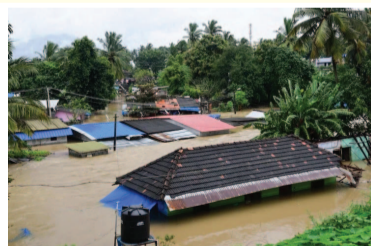
आठ डैम के लिए ऑरेंज अलर्ट जारी मंत्री ने कहा कि पम्पा नदी के तटों पर रहने वाले लोगों को वहां से हटाने की तैयारी कर ली गई है। फिलहाल जिले में 83 कैम्प बनाए गए

सरकार ने काकी डैम को खोल कर करीब 200 क्यूमेक्स पानी छोड़ने का फैसला किया है। उन्होंने कहा कि यह फैसला डैम के जलस्तर के खतरों के निशान को पार करने और मौसम विभाग द्वारा 20 अक्टूबर को भारी बारिश के पूर्वानुमान को देखते हुए लिया गया है। उन्होंने कहा कि अभी डैम का पानी नहीं छोड़ा गया तो हालात और बिगड़ सकते हैं। उन्होंने कहा कि हालात को देखते हुए अभी सबरीमाला में पूजा की अनुमति नहीं दी जा सकती। उल्लेखनीय है कि भगवान अय्यप्पा मंदिर में तुला पूजा के लिए इसे 16 अक्टूबर से खोला गया था।