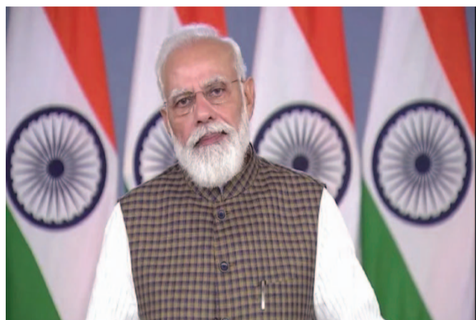
लाभ मिल सकता है। देश लूटने वाले लोग कितने ही ताकतवर क्यों न हो हम उसे नहीं छोड़ते आज देश को ये भी विश्वास हुआ है कि देश को धोखा देने वाले, गरीब को

लूटने वाले, कितने भी ताकतवर क्यों न हो, देश और दुनिया में कहीं भी हों, अब उन पर रहम नहीं किया जाता, सरकार उनको छोड़ती नहीं है। उन्होंने कहा कि भ्रष्टाचार पर काबू पाने के लिए हमारी सरकार प्रोपेल, प्रोएक्टिव गवर्नेंस को सशक्त करने में जुटी है। पीएम मोदी ने आगे कहा कि भ्रष्टाचार से जुड़ी नई चुनौतियों के सार्थक समाधान तलाशने के लिए आप सब सरदार वल्लभ भाई पटेल के सानिध्य में महामंथन के लिए जुटे हैं। सरदार पटेल ने हमेशा गवर्नेंस को भारत के विकास का, जन सरोकार का, जन हित का आधार बनाने को सर्वोच्च प्राथमिकता दी है।