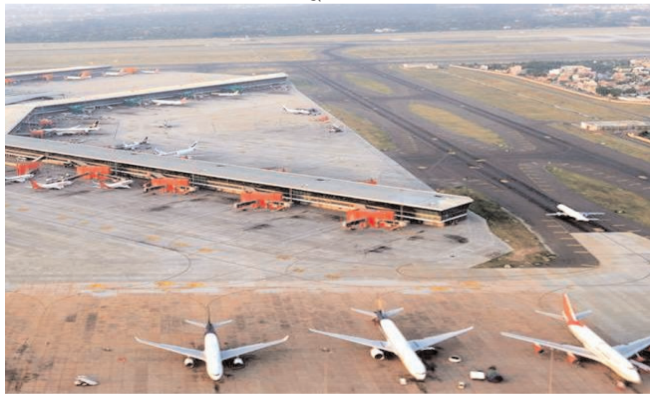
कर दिया गया है। केंद्र सरकार ने 'उड़ान' योजना के

अड्डे हैं। सबसे अधिक चार-चार अंतरराष्ट्रीय एयरपोर्ट तमिलनाडु और केरल में हैं। उत्तर भारत के किसी भी राज्य में दो से अधिक एयरपोर्ट नहीं हैं। अकेले यूपी में पांच अंतरराष्ट्रीय एयरपोर्ट कुशीनगर एयरपोर्ट के उद्घाटन और आने वाले समय में अयोध्या एयरपोर्ट के साथ बहुत जल्द यहाँ पांच अंतरराष्ट्रीय हवाई अड्डे होंगे। जबकि 21 एयरपोर्ट और सात हवाई पट्टियों के क्रियाशील होने की प्रक्रिया चल रही है। उत्तर प्रदेश सबसे अधिक पांच अंतरराष्ट्रीय एयरपोर्ट वाला राज्य बनने को तैयार है। सरकार वर्ष 2024 तक जेवर से भी अंतरराष्ट्रीय विमान सेवाएं शुरू करने की तैयारी में है।