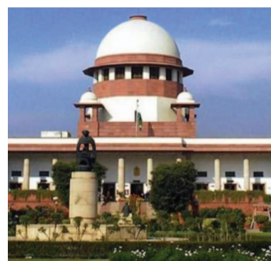
खुद को हुए नुकसान का है। यह ट्रक में सवार यात्रियों की संख्या पर किसी तरह निर्भर नहीं है। ऐसे में आयोग का फैसला कानून संगत नहीं है और इसे रद्द किया जाता है। सुप्रीम कोर्ट ने इलाहाबाद हाईकोर्ट के एक आदेश को

जस्टिस हेमंत गुप्ता और जस्टिस वी रामसुब्रह्मण्यन की पीठ ने आयोग के तर्कों को स्पष्ट रूप से गलत बताया और बीमा कंपनी न्यू इंडिया एश्योरेंस को ट्रक के मालिक को 3.25 लाख रुपये का मुआवजा देने का निर्देश दिया। पीठ ने अपने 30 सितंबर के आदेश में कहा, लापरवाही से वाहन चलाने के कारण यात्री को देय मुआवजे के लिए तीसरे पक्ष के दावे के बीच स्पष्ट अंतर है, जबकि वर्तमान मामला