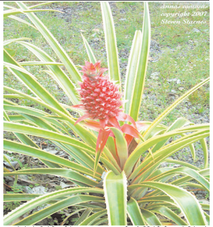
Anna's comoda copyright 2007 Steven Starnes

सकर : पौधे के मूल-तंत्र से निकली हुई पत्तियों वाली