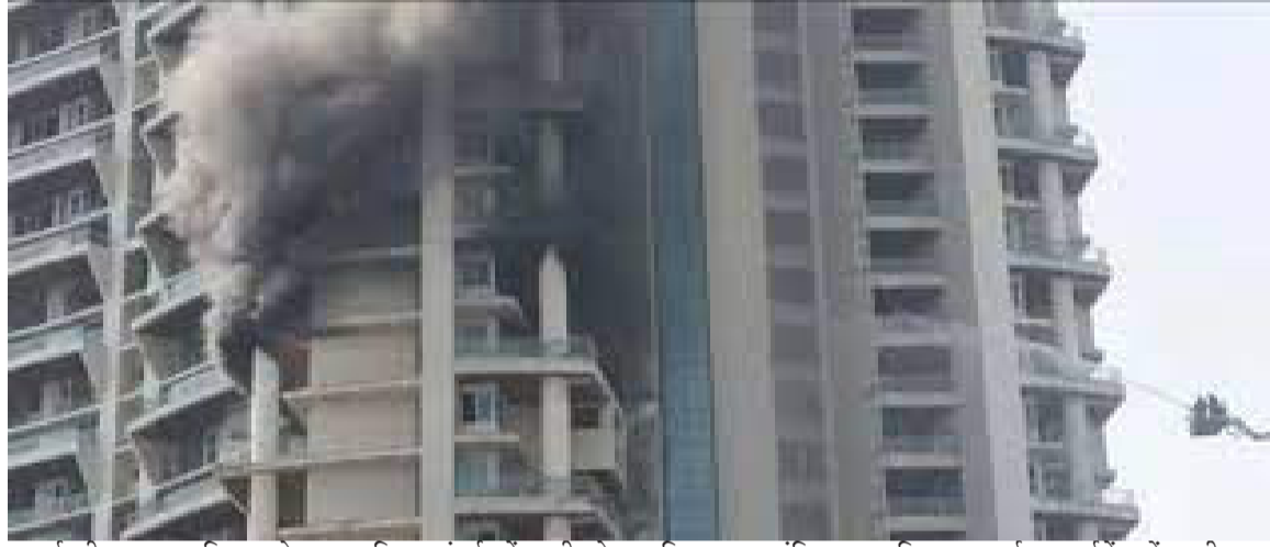
लगाई थी. दमकल विभाग के मुताबिक मुंबई में करी रोड स्थित बहुमंजिला अविष्ठा पार्क अपार्टमेंट में लगी आग

फंसे लोगों को बाहर निकाल लिया गया है. आग बुझाने में फायर ब्रिगेड की 20 से ज्यादा गाड़ियां लगी रही. इस बिल्डिंग में कई बड़े बिजनेसमैन रहते हैं. इस इमारत का नाम 'अविष्ठा पार्क अपार्टमेंट' है. दमकल विभाग के मुताबिक आग दोपहर करीब 11.50 बजे लगी. अपार्टमेंट में लगी आग में एक व्यक्ति घायल हुआ. मुंबई दमकल विभाग के मुताबिक उस व्यक्तिने बिल्डिंग की 19वीं मंजिल से छलांग