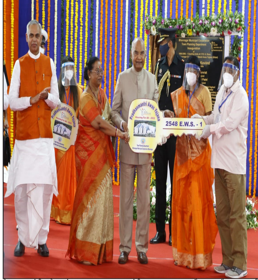
राष्ट्रपति ने दिवाली से पहले गृह प्रवेश करनेवाले लाभार्थियों को शुभकामनाएं दीं। राष्ट्रपति ने प्रतीक स्वरूप 5 लाभार्थियों को आवास की चाबी अर्पण करते हुए पीएनजी पाइपलाइन समेत अत्याधुनिक आवासीय सुविधाओं की प्रशंसा की। साथ ही गुजरात में पीएमएवाय समेत हाउसिंग प्रोजेक्ट क्षेत्र की प्रगति पर संतोष व्यक्त करते हुए आवश्यक मार्गदर्शन दिया। आवास लोकार्पण के अवसर पर 2022 तक सभी को आवास उपलब्ध कराने

भावनगर, राष्ट्रपति रामनाथ कोविंद ने शुक्रवार को भावनगर में प्रधानमंत्री आवास योजना-शहरी (पीएमएवाय-यू) के तहत ₹ 58.83 करोड़ की लागत से नवनिर्मित 1088 ईडब्ल्यूएस-1 आवासों का लोकार्पण किया। इस मौके पर गुजरात के राज्यपाल आचार्य देवव्रत और मुख्यमंत्री भूपेंद्र पटेल उपस्थित रहे। भावनगर महानगर पालिका क्षेत्र में पीएमएवाय के नवनिर्मित आवासों का लोकार्पण करते हुए राष्ट्रपति ने दिवाली से पहले गृह प्रवेश करनेवाले लाभार्थियों को शुभकामनाएं दीं। राष्ट्रपति ने प्रतीक स्वरूप 5 लाभार्थियों को आवास की चाबी अर्पण करते हुए पीएनजी पाइपलाइन समेत अत्याधुनिक आवासीय सुविधाओं की प्रशंसा की। साथ ही गुजरात में पीएमएवाय समेत हाउसिंग प्रोजेक्ट क्षेत्र की प्रगति पर संतोष व्यक्त करते हुए आवश्यक मार्गदर्शन दिया। आवास लोकार्पण के अवसर पर 2022 तक सभी को आवास उपलब्ध कराने