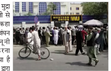
लेनदेन करें और विदेशी मुद्रा का उपयोग करने से सख्ती से परहेज करें। बयान में कहा गया, इस आदेश का उद्देश्य करने वाले को कानूनी कार्रवाई का सामना करना पड़ेगा। रिपोर्ट में कहा गया है कि अगस्त में तालिबान द्वारा देश पर नियंत्रण करने के बाद, अफगानिस्तान की अर्थव्यवस्था को विदेशी संपत्ति अमेरिकी फेडरल रिजर्व और यूरोप में केंद्रीय बैंकों द्वारा जब्त कर ले दी थी। डिप्टी यूएस ट्रेजरी सेंक्रेटरी वैली अडेमो ने पिछले महीने सीनेट

के बाद से अंतर्राष्ट्रीय वित्तीय सहायता वापस लेने के कारण खराब अर्थव्यवस्था से जुझ रही है। अफगानिस्तान के बाजारों में अमेरिकी डॉलर का व्यापक रूप से उपयोग किया गया है। डॉलर का उपयोग अक्सर पाकिस्तान जैसे अफगानिस्तान के पड़ोसी देशों की सीमा से लगे क्षेत्रों में व्यापार के लिए भी किया जाता है। तालिबान के प्रवक्ता जबीहुल्ला मुजाहिद ने कहा, इस्लामिक अमीरात सभी नागरिकों, दुकानदारों, व्यापारियों और आम जनता को निर्देश देता है कि अब से अफगानियों में सभी