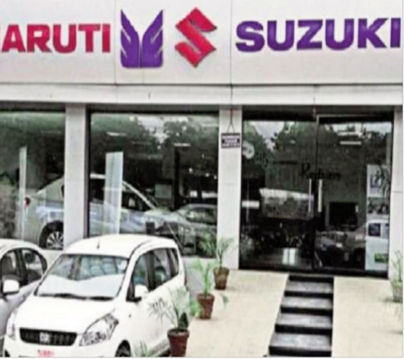
खुदरा क्षेत्र के लिए पिछले एक दशक का सबसे खराब त्योहारी सीजन रहा है। चिप की कमी से यात्री वाहन खंड में आपूर्ति