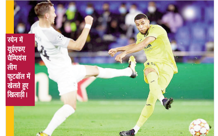
स्पेन में यूईएफए चैंपियंस लीग फुटबॉल में खेलते हुए खिलाड़ी।

अब श्रीलंका के स्पिनरों वांनिंदु हसरंगा और महीशा तीक्ष्णा से निबटने के लिये बेहतर तैयारियों के साथ मैदान पर उतरना होगा। श्रीलंका के तेज गेंदबाज चिंका करुणारत्ने, दुशमंत चमीरा और लाहिरू कुमारा इंग्लैंड के खिलाफ नहीं चल पाये थे। उन्हें सही स्थानों पर गेंदबाजी करने की जरूरत है। श्रीलंका के बल्लेबाजों को भी अच्छी शुरुआत का फायदा उठाना होगा। इंग्लैंड के खिलाफ उसके कम से कम छह बल्लेबाजों ने अच्छी शुरुआत की थी लेकिन वे उसे बड़े स्कोर में नहीं बदल पाए थे। सलामी बल्लेबाज कुसाल परेरा भले ही पिछले मैच में नाकाम रहे थे लेकिन कैरेबियाई गेंदबाजों को उनसे सतर्क रहना होगा।