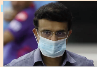
एक प्रशासक और कोच के तौर पर भी वह सफल रहे हैं। उन्होंने बांग्ला क्रिकेट संघ के अध्यक्ष के रूप में भी लंबे समय तक अपनी सेवाएं दी हैं।