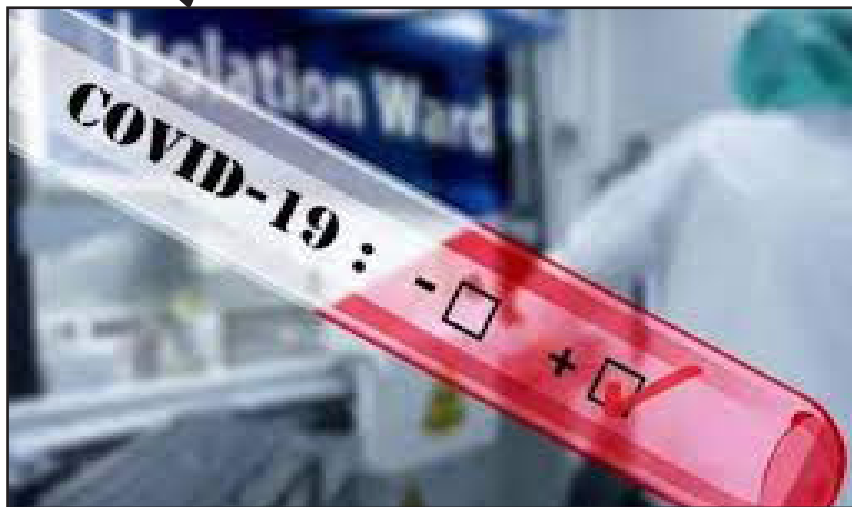
देवभूमि द्वारका में 2, जूनागढ़ 2, मोरबी में 2, राजकोट में 2, बनासकांडा में 1, भावनगर में 1, साबरकांडा में 2, अमरेली में 1, भावनगर कॉर्पोरेशन में 1,

अधिक नागरिकों का टीकाकरण किया गया। स्वास्थ्य विभाग से प्राप्त जानकारी के मुताबिक पिछले 24 घंटों में कोरोना के सबसे अधिक 178 नए मामले अहमदाबाद कॉर्पोरेशन में सामने आए हैं। सुरत कॉर्पोरेशन में 52, राजकोट कॉर्पोरेशन में 35, वडोदरा कॉर्पोरेशन में 34, आणंद में 12, नवसारी में 10, सुरत में 9, गांधीनगर में 7, जामनगर कॉर्पोरेशन में 7, खेडा में 7, वलसाड में 7, कच्छ में 5, अहमदाबाद में 4, भस्व में 3, गांधीनगर कॉर्पोरेशन में 3,