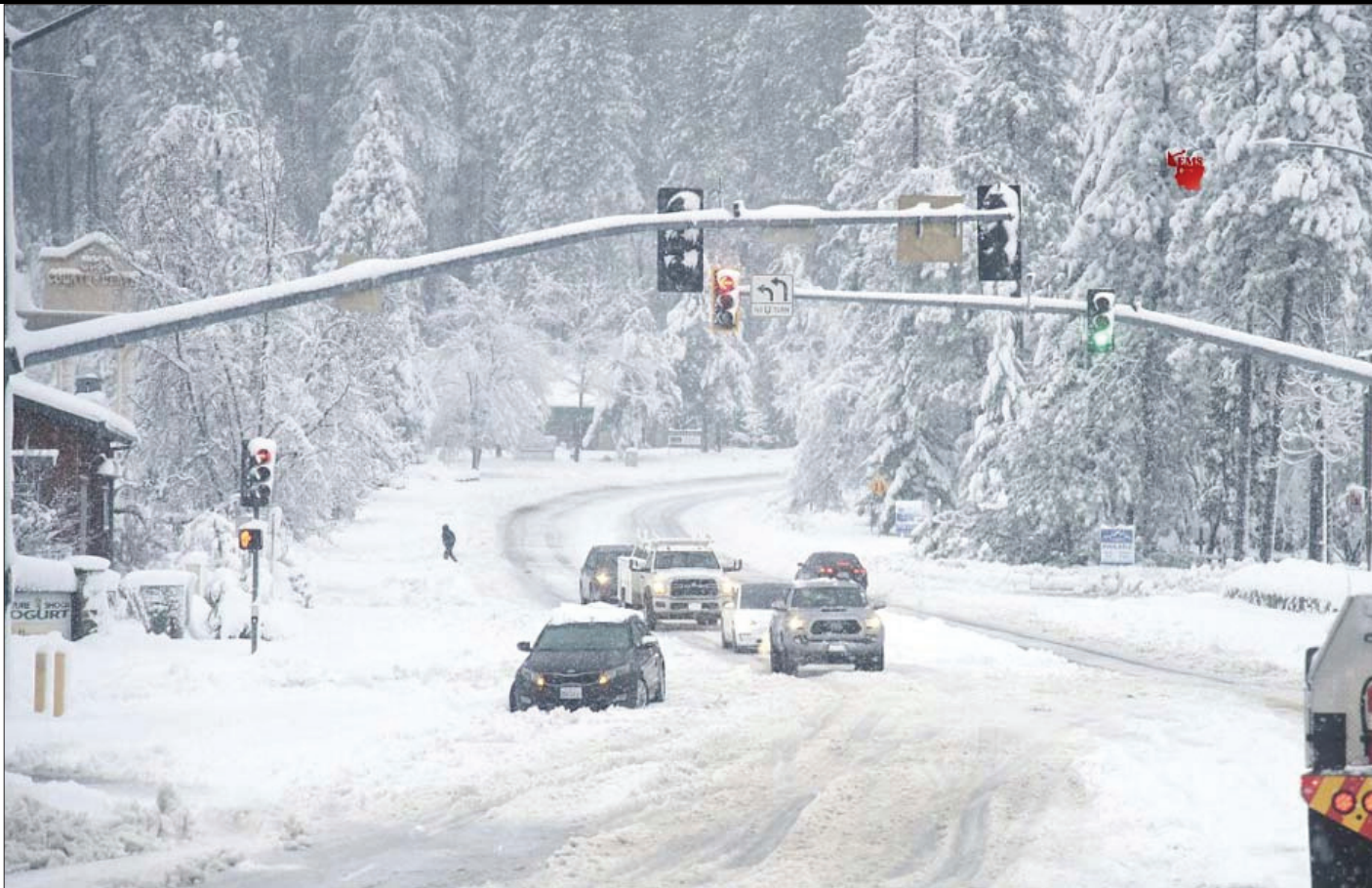
कैलीफोर्निया में बर्फबारी में फसे हुए वाहन।

विदेश कार्यालय ने कहा भारत से इन घृणास्पद भाषणों और अल्पसंख्यकों के खिलाफ व्यापक हिंसा की घटनाओं की जांच करने और भविष्य में ऐसी घटनाओं को रोकने के लिए उपाय करने की उम्मीद है। विदेश कार्यालय ने कहा भारत से इन घृणास्पद भाषणों और अल्पसंख्यकों के खिलाफ व्यापक हिंसा की जांच करने और भविष्य में ऐसी घटनाओं को रोकने के लिए उपाय करने की उम्मीद की जाती है।