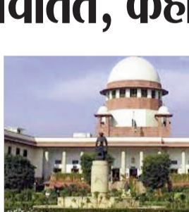
नई दिल्ली ।