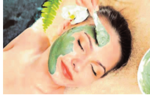
बढ़ाने वाली होती है। इसकी पतियों को पानी भिगोकर मसलकर पानी को छान लें।

-हरे धनिये की पतियां वातनाशक और पाचनशक्ति को