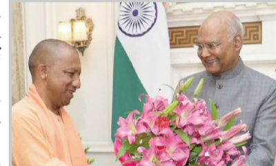
बीजेपी को राज्य की 403 सदस्यीय विधानसभा के लिए हाल में हुए चुनावों में 255 सीट हासिल हुई हैं और उसके दो सहयोगी दलों ने 18 सीट जीती हैं। राजनीतिक विश्लेषकों का मानना है कि इस जीत के साथ आदित्यनाथ का कद बढ़ा है, क्योंकि राज्य में बीजेपी के फिर जीतने के प्रयासों के केंद्र में उनका नेतृत्व था।

मुख्यमंत्री के रूप में लगातार दूसरे कार्यकाल के लिए शपथ लेने की तैयारी कर रहे आदित्यनाथ ने पार्टी नेतृत्व के साथ वार्ता के दौरान सरकार गठन से जुड़े मुद्दों पर चर्चा की। उत्तर प्रदेश विधानसभा चुनाव में उप मुख्यमंत्री केशव प्रसाद मौर्य समेत कई मंत्रियों की हार के बाद योगी आदित्यनाथ दिल्ली दौरे पर पहुंचे हैं। सूत्रों ने बताया कि आदित्यनाथ के दो दिन तक राष्ट्रीय राजधानी में ठहरने की संभावना है।