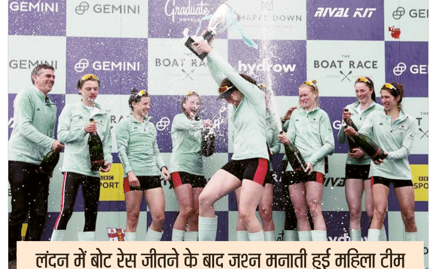
लंदन में बोट रेस जीतने के बाद जश्न मनाती हुई महिला टीम

पर है। महिला खिलाड़ियों में कोनेरु हम्मी 2586 अंको के साथ विश्व में तीसरे तो 2517 अंको के विश्व रैंकिंग में पुरुष वर्ग में मौजूद विश्व चैम्पियन नॉर्वे के मेगनस कार्लसन 2864 अंको के साथ तो महिला वर्ग में चीन की हाऊ यीफान 2650 अंको के साथ लगातार शीर्ष पायदान पर बने हुए है।