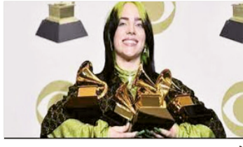
लॉस एंजेलिस ।

म्यूजिक इंडस्ट्री के ऑस्कर माने जाने वाले ग्रैमी अवार्ड्स की विनर लिस्ट सामने आ चुकी है। बड़े-बड़े दिग्गजों के नामों के बीच पाकिस्तान की गायक अरोज