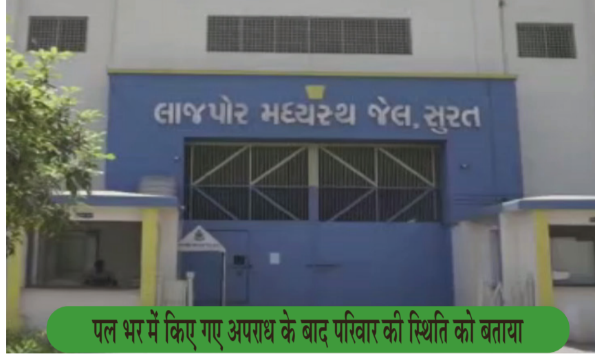
पल भर में किए गए अपराध के बाद परिवार की स्थिति को बताया

कई तरह की दिक्कतें आती हैं। समस्याओं का वर्णन करने वाले वीडियो का वर्णन जेल में कैदियों द्वारा किया गया था। अपराध पर अंकुश लगाने के