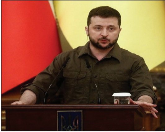
फैसिलिटी और दूसरा यूक्रेन के लोग।

यूक्रेन पर इस तरह के हमले के बाद जेलेन्स्की भी भड़के हैं। उन्होंने इन हमलों को आतंकी साजिश बताया है। राष्ट्रपति जेलेन्स्की ने खुद वीडियो जारी करके अपने देश के लोगों से अपील की है। उन्होंने कहा है कि रूस आतंकी हमला कर रहा है, इस कारण घर के अंदर ही रहें। जेलेन्स्की ने यह भी कहा कि उनके दफ्तर के पास हमला किया गया है। उन्होंने कहा, रूस दो जगहों को टारगेट कर रहा है, एक है एनजी