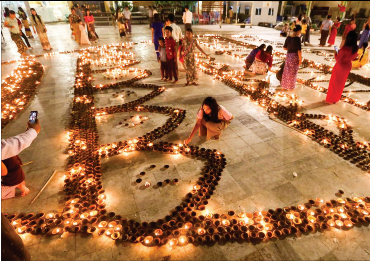
यंगून में पूर्णिमा के अवसर पर लोगों ने मौमवती जलाकर रौशनी की।

तेहरान। महसा अमीनी की मौत के बाद ईरान में बवाल धमने का नाम नहीं ले रहा है। आंदोलन तेज हो गया है और यह चौथे सप्ताह में प्रवेश कर गया है। सरकार विरोधी प्रदर्शनकारियों का समर्थन करने वाले संदेश के साथ लाइव प्रसारण के दौरान ईरान के राज्य टीवी को हैक कर लिया गया। शनिवार को रात के 9 बजे के शो के दौरान, स्क्रीन पर अचानक एक मुखौटा दिखाई दिया, जिसके बाद ईरान के सर्वोच्च नेता अली खामेनेई की तस्वीर आग की लपटों के साथ दिखाई दी। तस्वीर पर फारसी में टेक्स्ट लिखा हुआ था, जिसमें कहा गया था कि हमारे युवाओं का खून आपके हाथों पर है। मीडिया रिपोर्ट के अनुसार टीवी को हैक करने के बाद ईरानी नैतिकता पुलिस की हिरासत में दम तोड़ने वाली 22 वर्षीय महसा अमीनी सहित प्रदर्शन में मरने वालों की तस्वीरें दिखाई गईं।