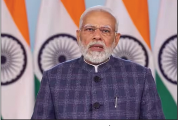
नहीं उनके संकल्प की भी होती है। पीएम मोदी ने कहा कि भारत के विकास और अभूतपूर्व प्रगति को लेकर न केवल भारतीय बल्कि इस पूरी दुनिया का हर व्यक्ति और हर संगठन पूरी तरह आश्चर्य है। उन्होंने कहा कि एक स्थिर सरकार एक निर्णायक सरकार और सही नीयत से चलने वाली सरकार विकास को अभूतपूर्व गति देती है। देश के लिए हर जरूरी फैसले लेती है। बीते आठ वर्षों में हमने रिफॉर्म की गति और स्केर को लगातार बढ़ाया है। उन्होंने साफ तौर पर कहा कि आईएमएफ

इंदौर (एजेंसी)। प्रधानमंत्री नरेंद्र मोदी ने बुधवार को मध्यप्रदेश ग्लोबल इन्वेस्टर्स सम्मिट का उद्घाटन किया है। इस मौके पर पीएम मोदी ने दावा किया कि 2014 के बाद भारत सुधार परिवर्तन और प्रदर्शन के पथ पर अग्रसर है। वचुंअल माध्यम से कार्यक्रम को संबोधित कर प्रधानमंत्री नरेंद्र मोदी ने कहा कि मध्य प्रदेश में ग्लोबल इन्वेस्टर्स सम्मिट उस समय में हो रही है जब भारत अग्रत काल में प्रवेश कर चुका है। हम विकसित भारत के निर्माण के पथ पर आगे बढ़ रहे हैं। उन्होंने कहा कि विकसित भारत के निर्माण में देश के दिल मध्य प्रदेश की भूमिका बहुत महत्वपूर्ण है। भक्ति और अध्यात्म से पर्यटन तक और कृषि से शिक्षा और कौशल विकास तक एमपी अजब भी है गजब भी और सजा भी है। उन्होंने कहा कि जब हम विकसित भारत की बात करते हैं तब बात देशवासियों की आकांक्षा की ही