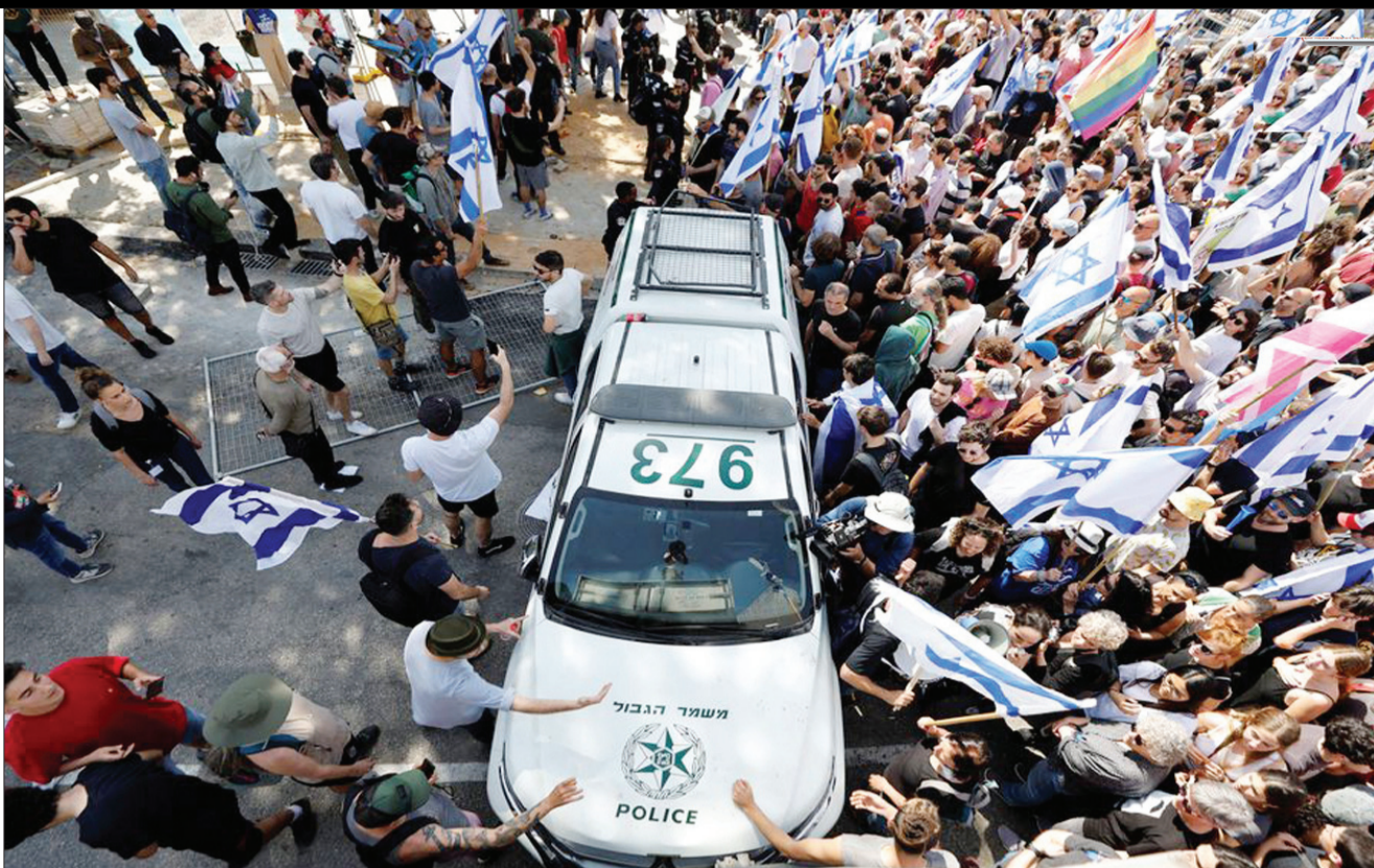
तल अवीव में इजरायली पुलिस के एक वाहन को घेरे हुए प्रदर्शनकारी। ये लोग एक कानून का विरोध कर रहे हैं।