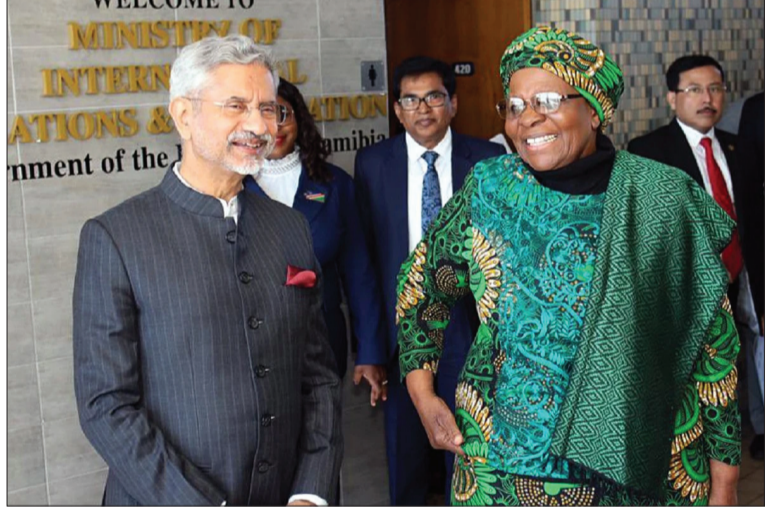
और प्रधानमंत्री नरेन्द्र मोदी का व्यक्तिगत संदेश उन्हें दिया।

जयशंकर ने ट्वीट किया, "ऊर्जा, हरित हाइड्रोजन, परिवहन और संपर्क, डिजिटल, औषधि (फार्मास्यूटिकल), खाद्य सुरक्षा, विज्ञान एवं प्रौद्योगिकी और संस्कृति के क्षेत्र में द्विपक्षीय संबंधों के विस्तार पर चर्चा किया। वन्यजीव सहयोग और हरित पर्यटन पर भी चर्चा हुई। क्षेत्रीय और वैश्विक मुद्दों पर हमारे विचार समान हैं।" वहीं, जयशंकर के साथ प्रतिनिधि-स्तरीय बैठक से पहले नामीबिया के विदेश मंत्री नेतुम्बो नंदी-नदेव्लाह ने जयशंकर के साथ बातचीत की थी। जयशंकर ने नामीबिया के राष्ट्रपति डॉक्टर हेग जी. गेइन्गोब से मुलाकात की