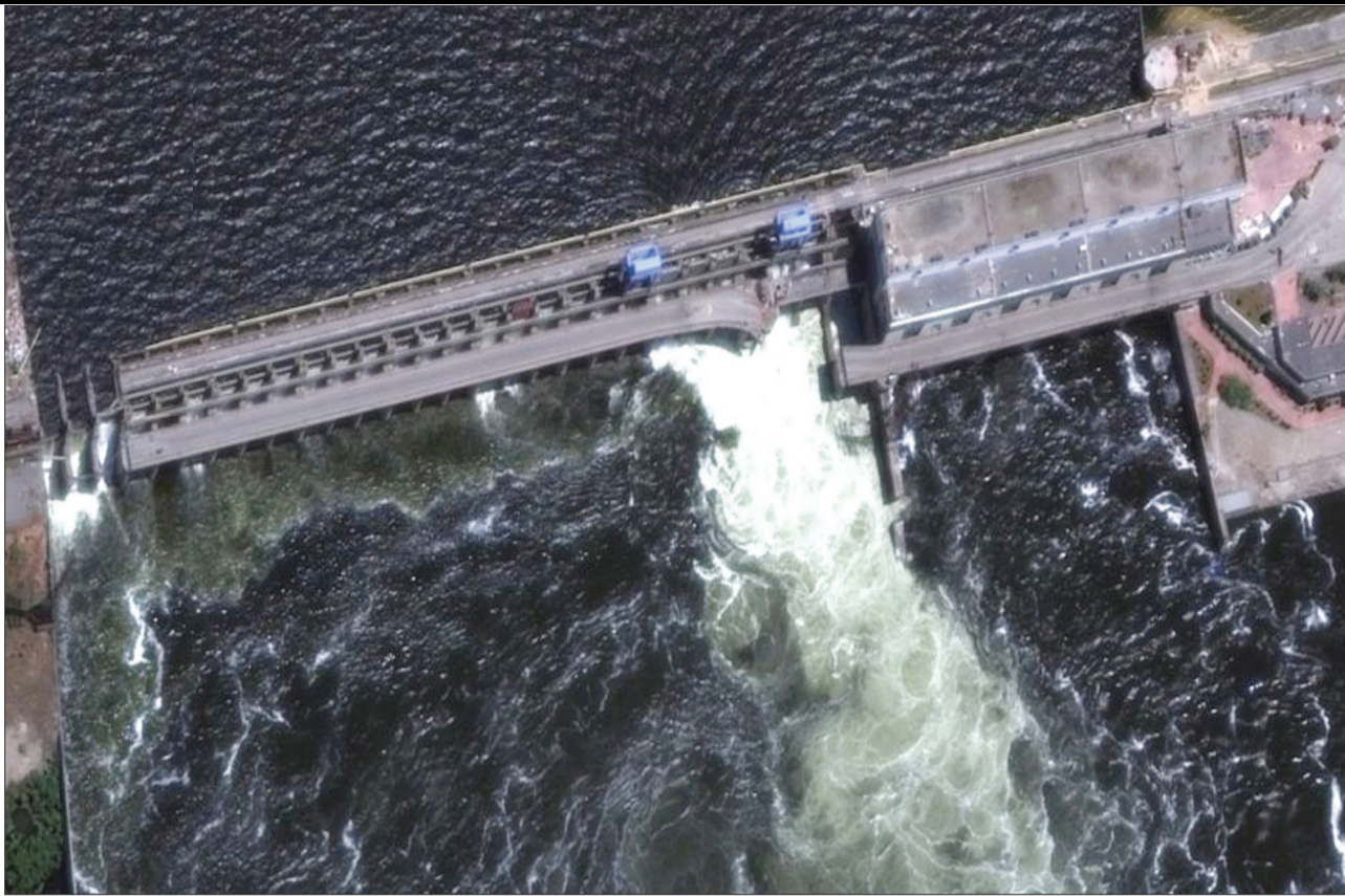
दक्षिण यूक्रेन के रुस नियंत्रित इलाके में सोवियत संघ के जमाने में बने एक डेम में हुए धमाके के बाद बाढ़ आ गयी। इसके लिए दोनो ने ही एक दूसरे की सेनाओं को दोष दिया है।

बड़े शहरों में कृत्रिम रोशनी से आसमान का जगमगाता, बिना शुरुत वाली जगहों पर भी कई-कई लाइट्स इस पॉल्यूशन को बढ़ाते हैं। शोधकर्ताओं का कहना है कि बहुत ज्यादा कृत्रिम रोशनी के कारण हमें नेचुरल और आर्टिफिशियल लाइट में फर्क महसूस नहीं हो पाता है। वर्ल्ड एटलस ऑफ आर्टिफिशियल लाइट स्काई की रिपोर्ट के मुताबिक, दुनियाभर में 80 फीसदी आबादी स्काईली पॉल्यूशन से जूझ रही है।