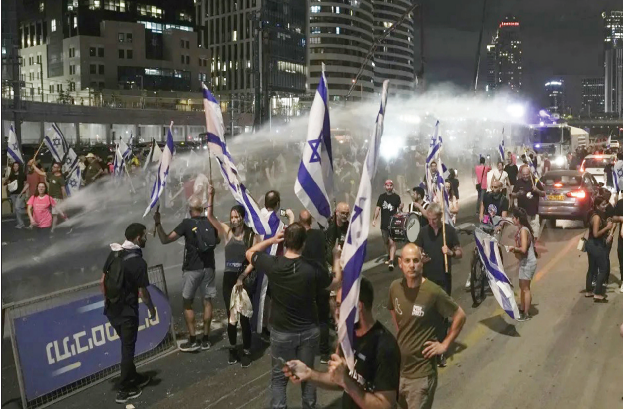
इजरायल में राष्ट्रपति बेंजामिन नेतनयाहू के खिलाफ प्रदर्शन करते हुए लोगों पर पारी की बौछारें की गयीं।

खबर के मुताबिक आईएमओ ने कहा कि माउंट फ़ाग्राडल्सफजाल के नीचे शाम करीब 4 बजे के आसपास झटके शुरू हुए थे। यह पतंग एक ज्वालामुखी के ऊपर स्थित है जहां पिछले दो सालों में रेकजेन्स प्रायद्वीप-आइसलैंड के दक्षिण-पश्चिमी सिरे पर दो विस्फोट हुए हैं। एजेंसी ने कहा कि करीब 2,200 भूकंपों का पता लगाया गया है और सबसे बड़े भूकंप आइसलैंड के दक्षिण-पश्चिम हिस्से में महसूस किए गए हैं। इसमें कहा गया है कि अधिक भूकंपीय गतिविधि की आशंका है।