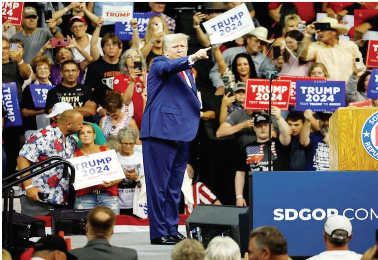
पूर्व अमेरिकी राष्ट्रपति और रिपब्लिकन राष्ट्रपति पद के उम्मीदवार डोनाल्ड ट्रम्प ने रैपिड सिटी, साउथ डकोटा में साउथ डकोटा रिपब्लिकन पार्टी की रैली में अपने समर्थकों की तरफ इशारा किया।

लंदन। दुनिया में विज्ञान तेजी से तरकी कर रहा है कि जो चीजे असंभव लगती थीं, वे अब संभव होनी दिख रही हैं। विज्ञान कहता है कि एक बच्चे के जन्म के लिए मानव स्पर्म और अंडे की जरूरत होती है, लेकिन वैज्ञानिकों ने मुमकिन कर दिया कि इसके बिना भी बच्चे को आसानी से पैदा किया जा सकता है यह हैरान कर देने वाला काम इजरायल में वैज्ञानिकों की एक टीम ने किया है। रिपोर्ट के मुताबिक यह जीएमन इंस्टीट्यूट की टीम ने किया है। टीम का कहना है कि स्टेम कोशिका का उपयोग करके 'थूण मॉडल' बनाया गया। इसमें इस्तरह के हार्मोन भी निकाले जिससे तैब में प्रेगनेंसी टेस्ट भी पॉजिटिव हो गया। वैज्ञानिकों ने एक बेहद अहम बात कही है। उनका कहना है कि यह नया मॉडल असली थूण की तरह हिसाबित हो सकता है। यह रोमांचक है क्योंकि इससे हमें यह जानने में मदद मिल सकती है कि बच्चे अपनी मां के अंदर कैसे विकसित होते हैं।