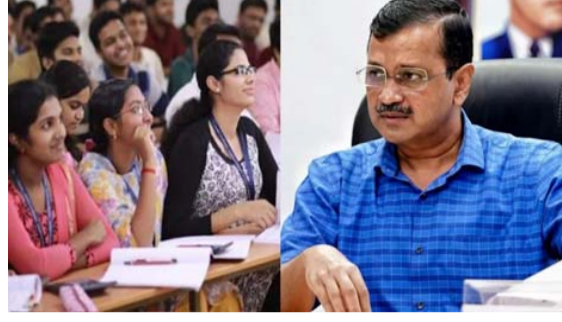
योजना आगे नहीं बढ़ पा रही थी। अब इस तरह का सिस्टम है। इन श्रेणियों से संबंधित मेधावी

योजना के तहत निजी कोचिंग संस्थान में मुफ्त कोचिंग के साथ छात्र को 2500 रुपये का मासिक वजीफा भी दिया जाएगा, जिसका उपयोग छात्र यात्रा व अध्ययन सामग्री की खरीद के लिए कर सकता है। इसमें प्रोत्साहन राशि भी जोड़ने की योजना है। छात्रों की संख्या भी बढ़ाई जाएगी। बदलाव के साथ जल्द ही इसे कैबिनेट में लाया जाएगा। कोरोना के बाद दोबारा यह योजना शुरू करने की कोशिश की गई थी, लेकिन फंड रुक जाने के कारण