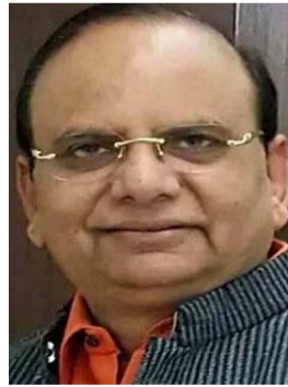
को मंजूरी ली थी। ये पद वर्ष 2013-14 से

रिक्तों के अनुसार इस तरह के 23 पद वर्ष 2020 में रिक्त थे और दो अन्य पद अप्रैल 2021 तक रिक्त हो गए थे। समाप्त किए गए 6 पदों में से तीन 2013-2014 में रिक्त थे, जबकि दो पद वर्ष 2014-15 में और 2016-17 से एक पद रिक्त है। इससे पहले, अप्रैल 2023 में शिक्षा विभाग ने एआर विभाग के अवलोकन के बाद 126 पदों की बहाली और शिक्षा