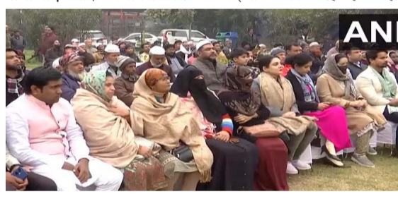
हैं। हमें विशेष सुविधाएं दी गईं, चाहे वह 'तीन तलाक' हो या कोई अन्य मुद्दा, किसी अन्य पार्टी ने ऐसा नहीं किया है। पीएम मोदी ने हमारे लिए

वहुत कुछ किया है। वह हमारे 'भाईजा' की तरह हैं... 'वहीं, पीएम मोदी का समर्थन करते