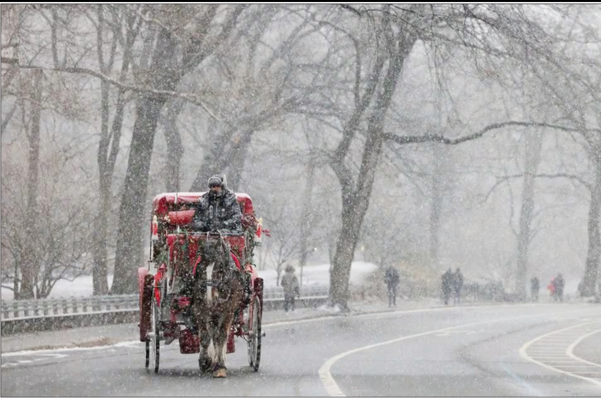
अमेरिका में बर्फबारी के बीच ही घोड़ागाड़ी चलाता हुआ एक व्यक्ति।