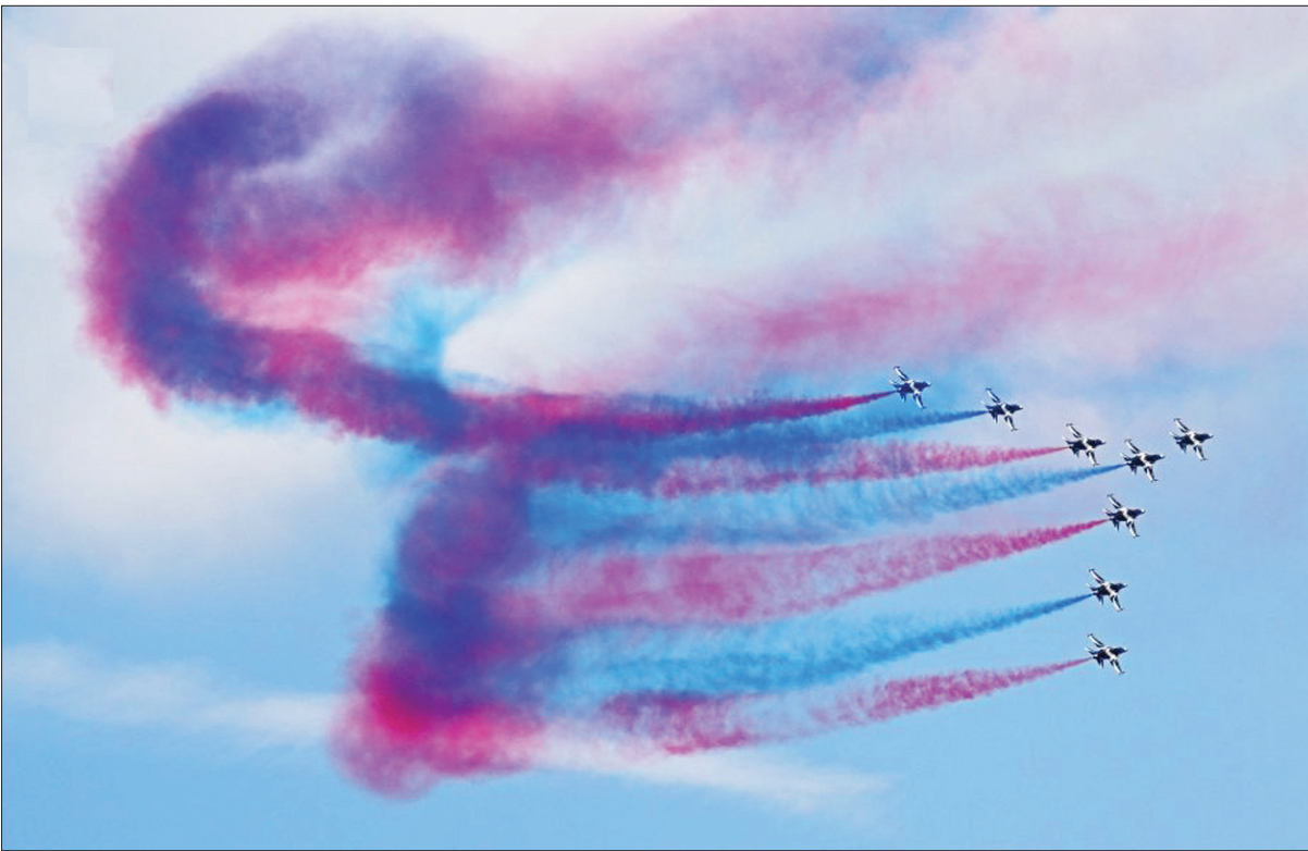
सिंगापुर में एयरशो में दक्षिण कोरियाई एरोबिक टीम अपने करतब दिखाती हुई।