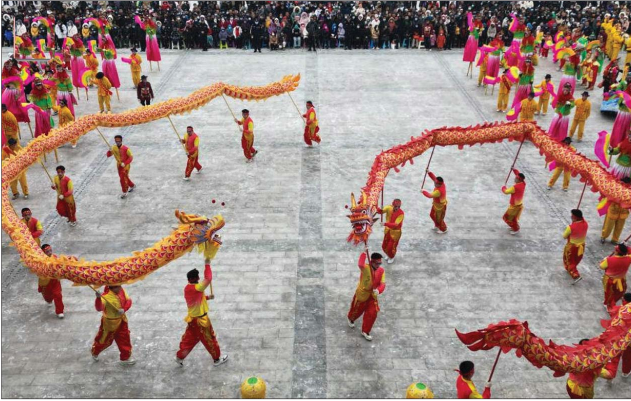
चीन में एक ड्रोन के जरिये ली गयी ड्रेगन डांस देखते हुए लोगों की तस्वीरों।

वाशिंगटन। गुगल के ईमेल प्लेटफॉर्म जीमेल ने सेवा समाप्त किये जाने संबंधी वायरल फर्जी संदेश को खारिज करते हुए कहा है कि यह सेवा जारी रहेगी। जीमेल ने सोशल मीडिया प्लेटफॉर्म 'एक्स' पर अपनी पोस्ट में कहा, 'जीमेल यहां रहने के लिए है।' इससे पहले जीमेल से आयी फर्जी ईमेल में दावा किया गया था कि अगस्त 2024 में यह सेवा समाप्त कर दी जायेगी। गत सितंबर में गुगल ने कहा था कि जीमेल अब यूजर्स को जनवरी 2024 से बेसिक ब्राउजर एचटीएमएल व्यू पर कनेक्टिविटी की अनुमति नहीं देगा। दूसरी तरफ गुरुवार को गुगल ने ऑटोफिशियल डेटेलीजेंस (एआई) मॉडल जीमिनी की लोगों को इमर्जिंग क्षमता को उस समय तक के लिए निर्लंबित कर दिया जब तक कि वे एआई मॉडल का उन्नत संस्करण जारी नहीं कर देंगे।