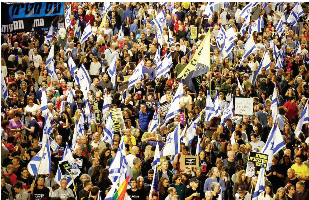
गाजा में इजरायली हमले में बंधक बनाये गये लोगों को रिहा करने में असफल रहने पर राष्ट्रपति बेंजामिन नेतनयाहू कर विरोध करते हुए लोग।

वाशिंगटन। अमेरिकी कांग्रेस (संसद) के निले सदन 'हाउस ऑफ रिपजेंटेटिव' ने टिक-टॉक पर प्रतिबंध लगाने वाले एक विधेयक को मंजूरी प्रदान कर दी है। इस विधेयक में प्रावधान है कि यदि चीनी नागरिक के स्वामित्व वाले लोकप्रिय सोशल मीडिया प्लेटफॉर्म टिक-टॉक अपने अमेरिकी कारोबार को नहीं बेचता तो उस पर देश में प्रतिबंध लगाया जा सकता है।