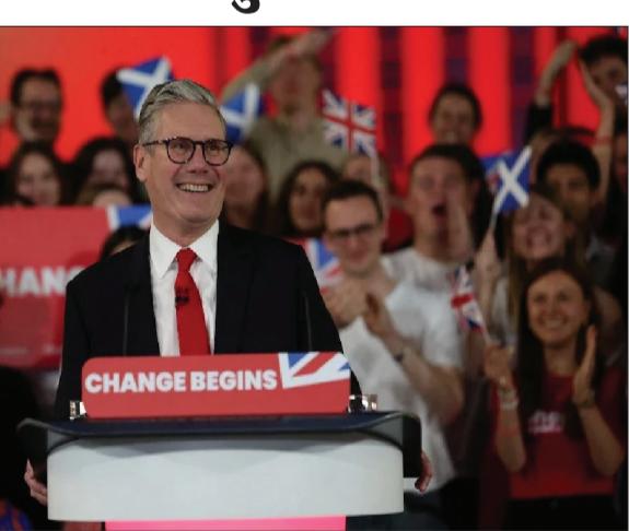
के बाद आधिकारिक रूप से ब्रिटेन के नए प्रधानमंत्री बन गए। ब्रिटेन के ऐतिहासिक आम चुनाव में उनकी पार्टी ने जीत हासिल की है। लेबर नेता स्टार्मर अपनी पत्नी विक्टोरिया स्टार्मर के साथ राजमहल पहुंचे।

लंदन (एजेंसी)। लेबर पार्टी के नेता कीर स्टार्मर महाराजा चार्ल्स तृतीय से मुलाकात के बाद आधिकारिक तौर पर ब्रिटेन के नए प्रधानमंत्री बने। नए प्रधानमंत्री कीर स्टार्मर ब्रिटेन के 58वें नेता के रूप में कार्यभार संभालने के लिए डाउनिंग स्ट्रीट पहुंचे। ब्रिटेन के नए प्रधानमंत्री के रूप में 10 डाउनिंग स्ट्रीट में कदम रखते हुए स्टार्मर ने कहा कि हमारा काम अत्यावश्यक है और हम इसे आज ही शुरू कर रहे हैं। मैं सम्मान और विनम्रता के साथ आप सभी को राष्ट्रीय नवीनीकरण के मिशन में इस सरकार में शामिल होने के लिए आमंत्रित करता हूँ। स्टार्मर ने कहा कि आपने हमें स्पष्ट जनादेश दिया है और हम इसका उपयोग परिवर्तन लाने तथा अपने देश को एकजुट करने के लिए करेंगे। सार्वजनिक सेवा एक विशेषाधिकार है। चाहे आपने लेबर पार्टी को दबोका हो या नहीं, मेरी सरकार आपकी सेवा करेगी। स्टार्मर ने कहा कि देश ने बदलाव के लिए मतदान किया है और हमें साथ मिलकर आगे बढ़ने की जरूरत है। स्टार्मर ने ब्रिटेन के पहले ब्रिटिश एशियाई प्रधानमंत्री बनने के लिए ऋषि सुनक के अतिरिक्त प्रयास की सराहना की। लेबर पार्टी के नेता कीर स्टार्मर शुक्रवार को बकिंघम पैलेस में महाराजा चार्ल्स तृतीय से मुलाकात