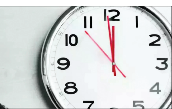
इसके पीछे सरकार कई कारण बता रही है। प्रधानमंत्री क्यारीकोस मिस्तोकोसि के प्रशासन का कहना है कि छह दिनों के काम को अनिवार्य बनाने इसलिए भी जरूरी था क्योंकि घटती आबादी और कुशल श्रमिकों की कमी के दोहरे खतरे का सामना करना पड़ रहा है। जून के अंत में श्रम मंत्रालय के एक संदेश के अनुसार, सरकार का यह भी कहना है कि छह-दिवसीय कार्यसप्ताह के बारे में औपचारिक नियम स्थापित करने से अघोषित काम की घटनाओं से निपटा जा सकेगा और कर्मचारियों की इनकम भी बढ़ेगी।