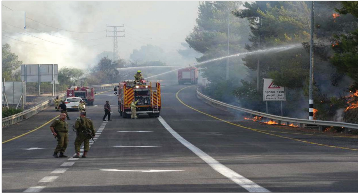
इजरायली फायर फाइटर लेबनान से दामे गये राकेट से लगी आग को बुझाने का प्रयास करते हुए।