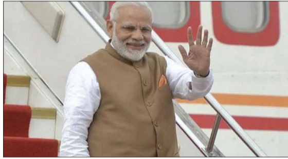
कार्यक्रम के तत्वों के हिस्से के रूप में प्रधानमंत्री क्रेमलिन में अज्ञात सैनिक की समाधि पर पुष्पांजलि भी अर्पित करेंगे और उसके बाद प्रधानमंत्री मारस्को में प्रदर्शनी स्थल का दौरा करेंगे। इन मुलाकातों के बाद दोनों नेताओं के बीच एक प्रतिबद्ध स्तर की बातचीत होगी, जिसके बाद प्रधानमंत्री और रूसी राष्ट्रपति के नेतृत्व में प्रतिनिधिमंडल स्तर की वार्ता होगी।

नई दिल्ली (एजेंसी)। प्रधानमंत्री मोदी की आगामी रूस यात्रा के बारे में विदेश सचिव विनय क्रात्रा ने कहा कि प्रधानमंत्री 8-9 जुलाई को 22वें वार्षिक शिखर सम्मेलन के लिए रूसी संघ के राष्ट्रपति के निमंत्रण पर मारस्को की आधिकारिक यात्रा करेंगे। अभी तक, प्रधानमंत्री का 8 जुलाई की दोपहर को मारस्को पहुंचने का कार्यक्रम है। राष्ट्रपति पवित्र आगमन के दिन प्रधानमंत्री के लिए एक निजी रात्रिभोज का आयोजन करेंगे। अगले दिन, प्रधानमंत्री की बातचीत में रूस में भारतीय समुदाय के साथ बातचीत शामिल होगी।