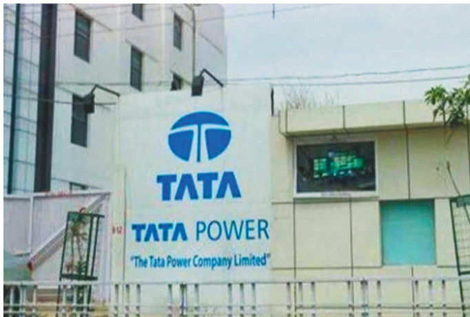
सोलर प्रोजेक्ट्स (टीपीआरईएल) विकसित करेगी।

नई दिल्ली, एजेसी। टाटा ग्रुप की कंपनी टाटा पावर ने भूटान में 5,000 मेगावाट की क्लीन एनर्जी कैपिसिटी के डेवलपमेंट के लिए एक बड़ी डील की है। यह डील भूटान की कंपनी ड्रुक ग्रीन पावर कॉरपोरेशन लिमिटेड (डीजीपीसी) के साथ की गई है। बता दें कि डीजीपीसी, ड्रुक होल्डिंग एंड इन्वेस्टमेंट्स लिमिटेड की सब्सिडरी है। यह भूटान की एकमात्र बिजली उत्पादन कंपनी है।