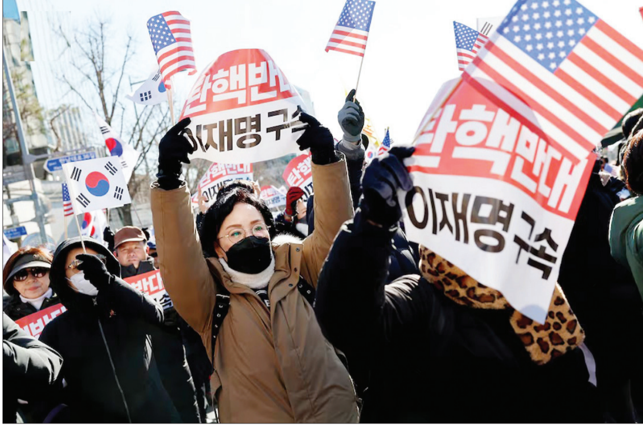
सियोल में राष्ट्रपति यून सुक के खिलाफ जांच के लिए जारी गिरफ्तारी वारंट का विरोध करते हुए लोगों में पोस्टर लेकर शामिल एक महिला।

न्यूक्लियर सेफ्टी से जुड़े डॉक्यूमेंट की हुई जांच रिपोर्ट के मुताबिक पाकिस्तान परमाणु ऊर्जा आयोग ने इस साल अप्रैल में लाइसेंस के लिए आवेदन किया था और उसने इसके साथ ही प्रारंभिक सुरक्षा आंकलन रिपोर्ट और परमाणु सुरक्षा, रेडिएशन प्रोटेक्शन, इमरजेंसी की तैयारी, वेस्ट मैनेजमेंट से जुड़े परिवालन संबंधी पहलुओं और डिजाइन के बारे में कई डॉक्यूमेंट्स भेजे थे। पाकिस्तान में अभी टोटल न्यूक्लियर पावर कैपेसिटी करीब 3500 मेगावाट है जो देश के कुल पावर प्रोडक्शन का लगभग 27 प्रतिशत है। पाकिस्तान के पास कराची-3 नाम का न्यूक्लियर प्लांट भी है जिसकी क्षमता करीब 1000 मेगावाट है।