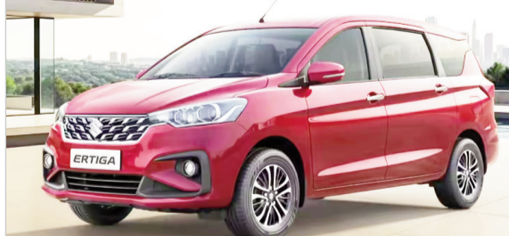
निकाल लेते हैं। देशभर में सीएनजी पंपों की संख्या भी तेजी से बढ़ी है, जिससे महोई ईंधन की तुलना में सीएनजी भरवाना आसान हो गया है। महारति, हुंडई और टाटा जैसे ब्रांड फेक्ट्री-फिट-सीएनजी कारें पेश कर रहे हैं। अब हैचबैक, सेडान और एसयूवी तक सीएनजी पोर्टफोलियो फैल गया है।

जिनमें लगभग 10.34 लाख सीएनजी कारें थीं। इसका मतलब है कि सीएनजी की हिस्सेदारी अब 22 प्रतिशत तक पहुंच गई है, जबकि तीन साल पहले यह केवल 12-13 प्रतिशत थी। पेट्रोल का शेर घटकर 47.48 फीसदी और डीजल का 18.08 फीसदी रह गया है, जबकि इलेक्ट्रिक वाहनों की हिस्सेदारी बढ़कर 4.25 फीसदी हो गई है। सीएनजी का खर्च प्रति किलोमीटर पेट्रोल से 40-50 फीसदी तक कम है। भले ही सीएनजी कारें 80,000-1,00,000 रुपये महंगी हों, 15,000-20,000 किलोमीटर सालाना चलाने वाले लोग अतिरिक्त लागत 18 महीनों में