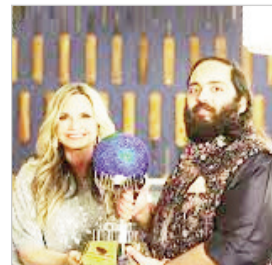
और उनके परिवारों के जीवन पर स्थायी प्रभाव डालेगा, उन्हें उम्मीद और सम्मान के साथ आगे बढ़ने में मदद करेगा।

ट्रेनिंग, ब्लैडर और बाउल मैनेजमेंट, साइकोलॉजिकल काउंसलिंग, न्यूट्रिशनल सपोर्ट और वोके शानल/फंक्शनल रिहैबिलिटेशन जैसी सेवाएं मुफ्त उपलब्ध कराई जाएंगी। इसका उद्देश्य मरीजों को आत्मनिर्भर, काम पर लौटने योग्य और समाज में सम्मान के साथ फिर से एकीकृत करना है। जीएसआईएफ के एक अधिकारी ने कहा, हम इस सार्थक सहयोग के लिए गहरी से आभारी हैं। यह योगदान मरीजों