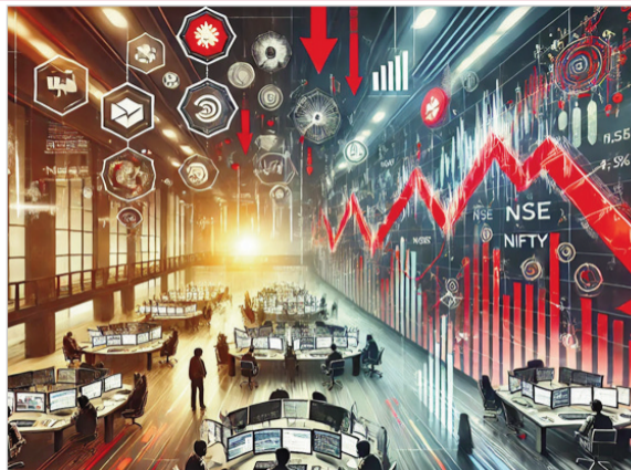
रुख के साथ 23,909 पर खुला और बाद में हल्की गिरावट के साथ 23,944 के आसपास कारोबार करता नजर आया।

179.25 अंक या 0.32 फीसदी की बढ़त के साथ 56,978.75 और निफ्टी स्मॉलकैप 100 इंडेक्स 27.95 अंक या 0.17 फीसदी की तेजी के साथ 16,566 पर बंद हुआ। बाजार जानकारों के अनुसार मूनाफावसूलों से भी बाजार गिरा है। इससे पहले आज सुबह एशियाई बाजारों से मिले कमजोर संकेतों और घरेलू स्तर पर बैंकिंग व आईटी शेयरों में बिकवाली के कारण बाजार गिरावट के साथ खुले। संसेक्स करीब 300 अंकों की गिरावट के साथ 77,319 पर खुला। वहीं निफ्टी भी कमजोर