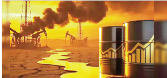
जहाजों को ही गुजरने देगा और टोल वसूलेगा, जबकि डोनाल्ड ट्रंप ने इसे टोल फी करने का दावा किया। इस भिन्न रुख से बाजार में अनिश्चितता बनी हुई है। विशेषज्ञ मानते हैं कि हाल का तनाव अब तक के सबसे बड़े तेल संकटों में से एक बन सकता है।

बेंचमार्क 100 डॉलर के नीचे फिसल गए थे, जिसमें डब्ल्यूटीआई ने अप्रैल 2020 के बाद सबसे बड़ी गिरावट दर्ज की थी। स्ट्रेट आफ होर्मुज वैश्विक तेल आपूर्ति का लगभग 20 फीसदी मार्ग है। ईराक, सऊदी अरब, कुवैत और कतर जैसे प्रमुख तेल उत्पादक देशों के निर्यात इसी मार्ग से होते हैं। इसलिए इस मार्ग में किसी भी बाधा से पूरी दुनिया में तेल की कीमतें प्रभावित हो सकती हैं। सीजफायर की घोषणा के बावजूद बुधवार को इस स्ट्रेट से केवल 4 जहाज गुजर पाए। ईरान ने कहा कि वह रोजाना केवल 12