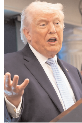
समीक्षा की मांग : दूसरी तरफ सीनेटर रिफ स्कॉट ने इस युद्धविराम को सही दिशा में उठाया गया कदम बताया

बुधवार को ट्रंप की नीतियों की बड़ी समर्थक रही लारा लुमर ने कहा कि इस युद्धविराम से अमेरिका के लिए जीत जैसा कुछ नहीं है। उन्होंने कहा कि इस समझौते से अमेरिका को कुछ हासिल नहीं हुआ और ईरान के लोग जश्न मना रहे हैं। उन्होंने सोशल मीडिया प्लेटफॉर्म एक्स पर एक पोस्ट में लिखा, 'हमें इससे असल में कुछ भी हासिल नहीं हुआ और ईरान में आतंकवादी जश्न मना रहे हैं।' क्या बोलीं लारा लुमर : लारा लुमर ने आगे लिखा, 'मुझे नहीं पता कि लोग ऐसा क्यों बताते कर रहे हैं जैसे यह कोई जीत हो। मुसलमान, वोक राइज और ट्रंप से नफरत करने वाले इस 'समझौते' का इस्तेमाल राष्ट्रपति ट्रंप पर हमला करने के लिए कर रहे हैं। वे टकर कार्लसन के सहयोगियों की तारीफ कर रहे हैं और राष्ट्रपति ट्रंप के खिलाफ 25वें संशोधन का इस्तेमाल करने की मांग कर रहे हैं। यह सीजफायर नाकाम होगा।' लारा लुमर ने कहा कि ट्रंप सही साबित होंगे कि ईरानी शासन को जड़ से मिटाने की जरूरत है, लेकिन फिलहाल ट्रंप गुमराह हो चुके हैं।