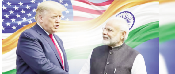
अधिकारी और व्यापारिक प्रतिनिधि मौजूद थे। भारत-अमेरिका संबंधों में पिछले वर्ष मई में कुछ तनाव देखा गया था। राष्ट्रपति डोनाल्ड ट्रंप के विवादाित दावों और वाशिंगटन द्वारा

करेगा और नए व्यापारिक अवसरों को उत्पन्न करने में मदद करेगा। पोर्टल का उद्देश्य दोनों देशों के व्यवसायियों के लिए सहयोग और संपर्क को सरल बनाना है। विदेश सचिव बुधवार से अपनी तीन दिवसीय यात्रा पर अमेरिका में हैं। इस दौरान उन्होंने अमेरिकी अधिकारियों के साथ द्विपक्षीय व्यापार, रक्षा सहयोग और वैश्विक घटनाक्रम जैसे मध्य पूर्व संकट पर चर्चा करेंगे। इस अवसर पर अमेरिका में भारत के राजदूत समेत दोनों देशों के वरिष्ठ