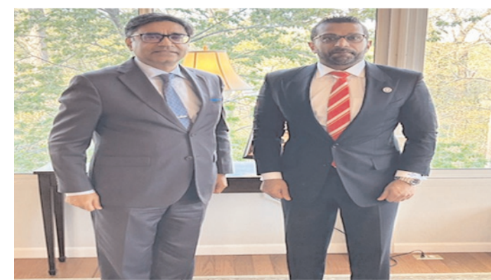
आपसी चिंता के क्षेत्रीय और वैश्विक विकास पर भी अपने विचार शेयर किए। 'अमेरिकी विदेश विभाग के मुख्य डिप्टी वैश्विक और क्षेत्रीय प्राथमिकताओं के बारे में मिसरी के साथ अपनी मीटिंग में 'दोनों देशों के बीच करीबी पारदर्शिता को फिर से सुनिश्चित किया। बयान में कहा गया,

गोर ने इस बातचीत को एक प्रोडक्टिव मीटिंग बताया। उन्होंने कहा कि यह हमारे द्विपक्षीय संबंध, खासकर व्यापार, जरूरी मिन्नरल्स, रक्षा और क्वाड पर केंद्रित थी। गोर ने कहा, 'विदेश सचिव रुबियो आपने मझे भारत आने का इंतजार कर रहे हैं।' यह एक संभावित उच्च स्तरीय दौर का संकेत देता है। मिसरी और एफबीआई डायरेक्टर काश पटेल की मुलाकात सुरक्षा पर केंद्रित थी। भारतीय दूतावास ने कहा, 'दोनों ने आतंकवाद, सुनियोजित अपराध और नारकोटिक्स से निपटने में भारत-अमेरिका के मजबूत सहयोग पर विचारों का अच्छे लेन-देन किया।' यह मीटिंग पारंपरिक रक्षा संबंधों के साथ-साथ कानून लागू करने और अदरूनी सुरक्षा के मुद्दों पर दोनों देशों के बीच बढ़ते सहयोग पर जोर देती है। मिसरी ने उपसचिव क्रिस्टोफर लैंडौ के साथ भी बातचीत की। दूतावास ने कहा, 'उन्होंने आपसी प्राथमिकताओं पर चर्चा की।