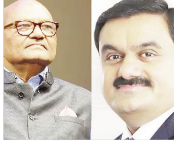
दिशा में आगे बढ़ेंगे। उन्होंने वेदांता की भागीदारी के लिए भी आभार जताया।

नवंबर में सीओसी ने लगभग 90 प्रतिशत वोटिंग के साथ अदाणी इंटरप्राइजेस लिमिटेड की 14,535 करोड़ रुपये की बोली को मंजूरी दी थी। इस प्रक्रिया में वेदांता लिमिटेड और डालमिया समूह ने भी भाग लिया था। बाद में 17 मार्च को एनसीएलटी की इलाहाबाद बेंच ने भी इस बोली को मंजूरी दे दी। हालांकि वेदांता ने 17,926 करोड़ रुपये की ऊंची बोली लगाई थी और अब उसने इस फैसले को एनसीएलटी में चुनौती दी है। वेदांता का दावा है कि उन्हें पहले अनौपचारिक रूप से समर्थन मिला था, जिसे बाद में बिना कारण बदला गया। इसके बावजूद, संस्थापक जयप्रकाश गौड़ का कहना है कि वह सीओसी के निर्णय का सम्मान करते हैं और उन्हें विश्वास है कि गौतम अडानी के नेतृत्व में जेपी एसोसिएट्स नई