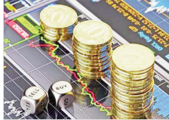
एसबीआई, आईसीआईसीआई बैंक, टीसीएस, बजाज फाइनेंस, लार्सन एंड टुब्रो, इन्फोसिस और हिंदुस्तान यूनिटीवर्क का स्थान रहा।

9,13,331.92 करोड़ रुपये रहा। हिंदुस्तान यूनिटीवर्क का मूल्यांकन 21,287.29 करोड़ रुपये बढ़कर 5,06,477.89 करोड़ रुपये हो गया। एचडीएफसी बैंक का बाजार पूंजीकरण 3,285.03 करोड़ रुपये बढ़कर 5,24,124.40 करोड़ रुपये रह गया। रिलायंस इंडस्ट्रीज की बाजार वैल्यूएशन 947.28 करोड़ रुपये बढ़कर 18,27,086.79 करोड़ रुपये पर आ गई। शीर्ष 10 कंपनियों में रिलायंस इंडस्ट्रीज पहले स्थान पर कायम रही। उसके बाद क्रमशः एचडीएफसी बैंक, भारतीय एयरटेल,