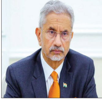
भारत की बढ़ती साख और प्रभाव को भी रेखांकित करेगा, जिससे आने वाले समय में वैश्विक समीकरणों में भारत की भूमिका और अधिक महत्वपूर्ण हो सकती है।

दौर का मुख्य उद्देश्य कतर, बहरीन, कुवैत और ओमान के साथ द्विपक्षीय संबंधों को और अधिक सशक्त बनाना है। इसके साथ ही, क्षेत्रीय घटनाक्रमों और आपसी हित के विभिन्न मुद्दों पर गहन विचार-अभिरंका शामिल हैं। आज से 10 जुलाई तक चलने वाली उनकी चार खाड़ी देशों की यात्रा ऐसे महत्वपूर्ण समय में हो रही है, जब अमेरिका और इंग्लैंड के बीच शांति समझौते के बाद इस क्षेत्र में राजनीतिक समीकरण तेजी से बदल रहे हैं। यह यात्रा भारत के लिए इन महत्वपूर्ण क्षेत्रों के साथ संबंधों को मजबूत करने और वैश्विक मंच पर अपनी उपस्थिति दर्ज कराने का एक बड़ा अवसर है।