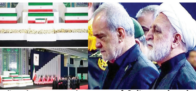
सर्वोच्च नेता अयातुल्ला मोजतबा खामेनेई की पत्नी शामिल थीं।

तेहरान, एजेंसी। ईरान के दिवंगत सुप्रीम लीडर अयातुल्ला अली खामेनेई के जनाजे की विशाल तैयारियां पूरी कर ली गई हैं। शनिवार से शुरू होने वाले इस बड़े अंतिम संस्कार से पहले तेहरान में आयोजित श्रद्धांजलि समारोह में भावुक माहौल दिखा। समारोह के दौरान ईरान के वर्तमान राष्ट्रपति मसूद पेजेरिश्कियन और संसद अध्यक्ष मोहम्मद बघेर गलिबाफ भावुक होकर रो पड़े। इन बड़े नेताओं के साथ पूरी देश की लीडरशिप भारी भीड़ के सामने फूट-फूट कर रोती हुई नजर आई। इस विशाल और ऐतिहासिक जनाजे में बहुत ही बड़ी संख्या में देश के आम नागरिक और दुनिया के कई नेता पहुंचे हैं। ईरान की सरकार इसे केवल एक साधारण शोक समारोह नहीं बल्कि अपनी मजबूत राष्ट्रीय एकता और राजनीतिक मजबूती मान रही है। इसके जरिए युद्ध के बाद देश की जनता के सामने अपनी विशाल शक्ति का बड़ा प्रदर्शन भी किया जा रहा है। तेहरान की सड़कों पर बैनर लगाए गए हैं जिन पर अरबी, फारसी और अंग्रेजी में खास संदेश लिखे गए हैं।