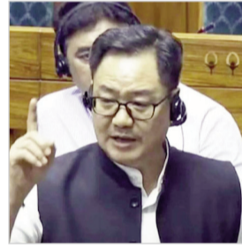
दलों के साथ मिलकर सरकार को कई अहम मुद्दों पर घेरने की रणनीति बनाएगी। विपक्ष चुनाव आयोग की कार्यप्रणाली, विशेष गहन पुनरीक्षण (एसआईआर), विदेश नीति, राष्ट्रीय सुरक्षा, चीन और अमेरिका से जुड़े व्यापारिक मुद्दों, परिसीमन, 'एक राष्ट्र-एक चुनाव' के प्रस्ताव, भ्रष्टाचार के आरोपों तथा लोकतांत्रिक संस्थाओं के कामकाज जैसे विषयों पर सरकार से जवाब मांगेगा। ऐसे में रणनीति और संसद में होने वाले राजनीतिक विमर्श के लिहाज से भी काफी महत्वपूर्ण साबित हो सकता है।

राष्ट्रीय महत्त्व के विभिन्न मुद्दों पर व्यापक चर्चा और बहस होगी। मानसून सत्र के दौरान विभिन्न मंत्रालयों से जुड़े विधेयकों, नई नीतियों और देशहित से जुड़े अहम विषयों पर संसद में विस्तृत विचार-विमर्श होने की संभावना है। सरकार कई महत्वपूर्ण विधेयकों को सदन में पेश कर उन्हें पारित कराने की कोशिश करेगी, जबकि विपक्ष भी विभिन्न मुद्दों पर सरकार से जवाब मांगने की तैयारी में है। सत्र को लेकर राजनीतिक गतिविधियां भी तेज हो गई हैं। कांग्रेस ने स्पष्ट किया है कि वह इंडिया गठबंधन के सहयोगी