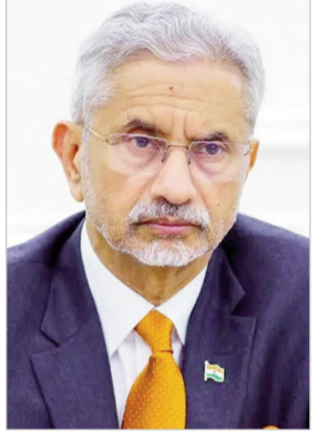
समय में वैश्विक समीकरणों में भारत की भूमिका और अधिक महत्वपूर्ण हो सकती है।

साथ ही, क्षेत्रीय घटनाक्रमों और आपसी हित के विभिन्न मुद्दों पर गहन विचार-विमर्श भी होगा, जिससे भारत की पश्चिम एशिया नीति को नई दिशा मिल सकती है। खाड़ी देशों का दौरा पूरा करने के बाद, विदेश मंत्री 13 जुलाई को न्यूयॉर्क के लिए प्रस्थान करेंगे, जहाँ वे संयुक्त राष्ट्र सुरक्षा परिषद (यूएनएससी) में साल 2028-29 के कार्यकाल के लिए भारत के आधिकारिक अभियान की शुरुआत करेंगे। यह कदम वैश्विक शासन में भारत की बढ़ती आकांक्षाओं और भूमिका को दर्शाता है, जहाँ भारत