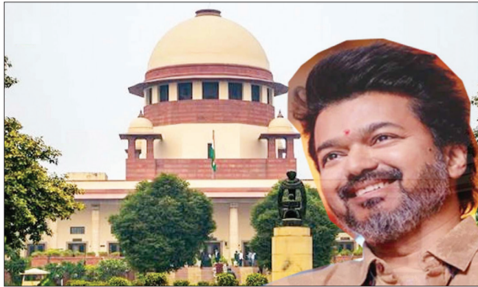
सकती है। यह लड़ाई कोर्ट के बाहर लड़ी जानी चाहिए। डीएमके ने याचिका दाखिल कर कहा था कि

मीडिया रिपोर्ट के मुताबिक सुप्रीम कोर्ट ने कहा कि हम किसी भी सीएम की गतिविधियों को तय नहीं करेंगे। जजों ने डीएमके के वकील से कहा कि वह कोर्ट को राजनीतिक लड़ाई का मंच न बनाएं। अगर सत्ताधारी टीवीके के नेता हादसे को लेकर बयान दे रहे हैं, तो डीएमके भी उसके जवाब में बयान दे