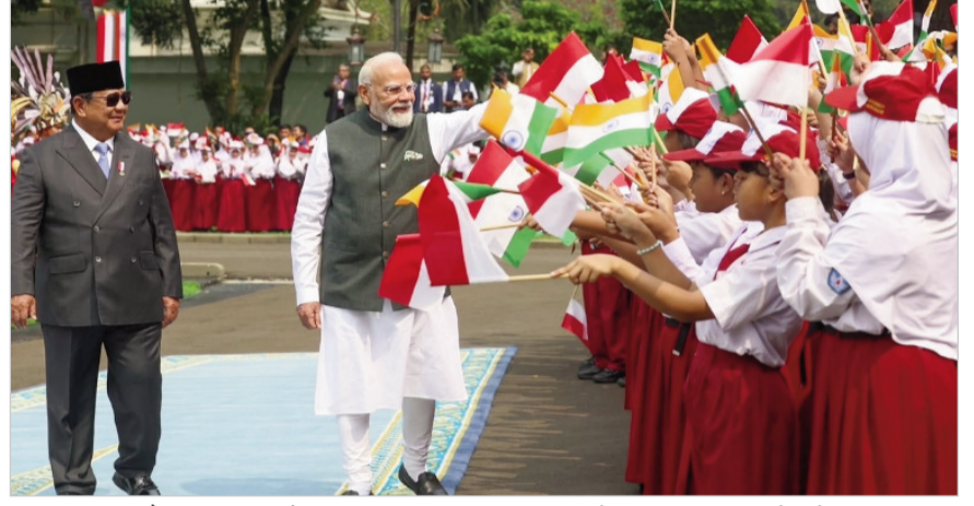
भारत-इंडोनेशिया की लोकतांत्रिक साझेदारी के साथ-साथ दोनों देशों के ऐतिहासिक संबंधों को एक नई दिशा देने वाला माना जा रहा है। संसद का यह संबोधन दोनों देशों के बीच केवल सरकारी स्तर पर ही नहीं, बल्कि विधायी और लोकतांत्रिक स्तर पर भी संबंधों को मजबूत करेगा। पचासी भारतीयों से संवादित के अंतिम पड़ाव में प्रधानमंत्री मोदी जकार्ता में भारतीय समुदाय के एक बड़े कार्यक्रम में शामिल होंगे।

भारत-इंडोनेशिया की लोकतांत्रिक साझेदारी के साथ-साथ दोनों देशों के ऐतिहासिक संबंधों को एक नई दिशा देने वाला माना जा रहा है। संसद का यह संबोधन दोनों देशों के बीच केवल सरकारी स्तर पर ही नहीं, बल्कि विधायी और लोकतांत्रिक स्तर पर भी संबंधों को मजबूत करेगा। पचासी भारतीयों से संवादित के अंतिम पड़ाव में प्रधानमंत्री मोदी जकार्ता में भारतीय समुदाय के एक बड़े कार्यक्रम में शामिल होंगे। अपने इस संबोधन में प्रधानमंत्री भारत की तेज विकास यात्रा और वैश्विक मंच पर देश की बढ़ती शक्ति का जिक्र करेंगे। साथ ही, वे भारत-इंडोनेशिया के सदियों पुराने सांस्कृतिक और जन-जन के रिश्तों को और प्रगाढ़ करने पर जोर देंगे। विशेषज्ञों का मानना है कि