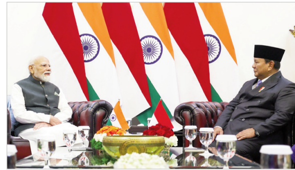
और मजबूत करने के लिए सार्थक चर्चा होगी। इसके अलावा, दोनों देशों के बीच सांस्कृतिक सहयोग को भी बढ़ावा मिलने की संभावना है। उम्मीद जताई जा रही है कि इस दौरे के दौरान प्रभुमान मंदिर

गति मिलेगी। प्रधानमंत्री मोदी के सम्मान में जकार्ता स्थित राष्ट्रपति भवन सडका पैलेस में औपचारिक स्वागत समारोह आयोजित किया गया। इस दौरान राष्ट्रपति प्रबोवो सुबियांतो ने गर्मजोशी से उनका स्वागत करते हुए गले लगाया। समारोह में दोनों देशों के वरिष्ठ अधिकारी और मंत्री भी मौजूद रहे। प्रधानमंत्री ने राष्ट्रपति भवन में स्थित अतिथि पुस्तिका पर हस्ताक्षर किए, जहां राष्ट्रपति सुबियांतो भी उनके साथ मौजूद रहे। इंडोनेशिया दौरे के दूसरे दिन प्रधानमंत्री के स्वागत के लिए बड़ी संख्या में स्कूली बच्चे भारत और इंडोनेशिया के राष्ट्रीय ध्वज लेकर खड़े दिखाई दिए। प्रधानमंत्री ने बच्चों का अभिवादन स्वीकार करते हुए उनके बीच पहुंचकर हाथ हिलाया, जिससे वहां उत्साह का माहौल देखने को मिला। प्रधानमंत्री मोदी ने जकार्ता में मिले विशेष स्वागत का वीडियो सोशल मीडिया मंच 'एक्स' पर साझा करते हुए इसे यादगार बताया। उन्होंने कहा कि राष्ट्रपति प्रबोवो सुबियांतो द्वारा स्वयं एयरपोर्ट पहुंचकर किया गया स्वागत उनके लिए बेहद आत्मीय और भावनात्मक अनुभव रहा। प्रधानमंत्री ने विश्वास जताया कि इस यात्रा के दौरान दोनों देशों के बीच विभिन्न क्षेत्रों में सहयोग को